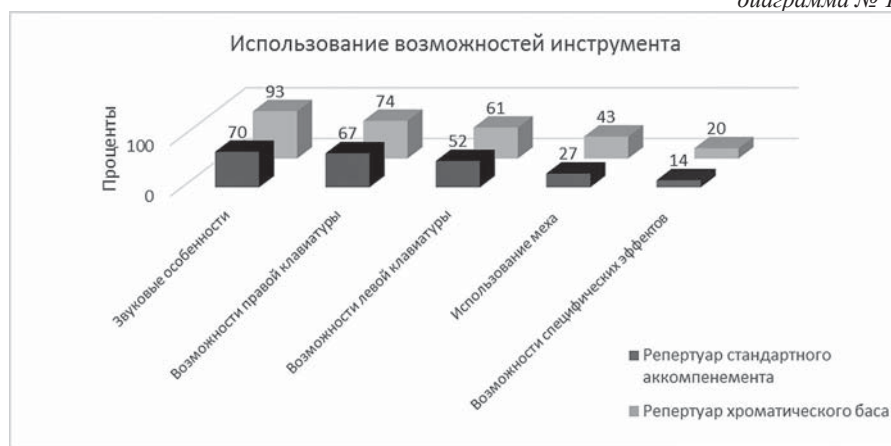
диаграмма № 1.

Видно, как оцениваются анализируемые произведения в отношении возможностей использования инструмента. Очевидно, что для обоих типов инструментов реализованы одинаковые возможности. Это возможности выразительности обеих клавиатур и звуковые. Совпадают и нереализованные возможности инструментов обоих типов. Правда, репертуар хроматического баса оценивается больше с учетом его индивидуальности. Все возможности этого инструмента использованы в большей мере по сравнению с репертуаром стандартного аккомпанемента. Это свидетельствует о связи рассматриваемых произведений с исполнительским искусством. Развивая направление академического музицирования, композиторы все больше выявляли различные возможности инструмента.