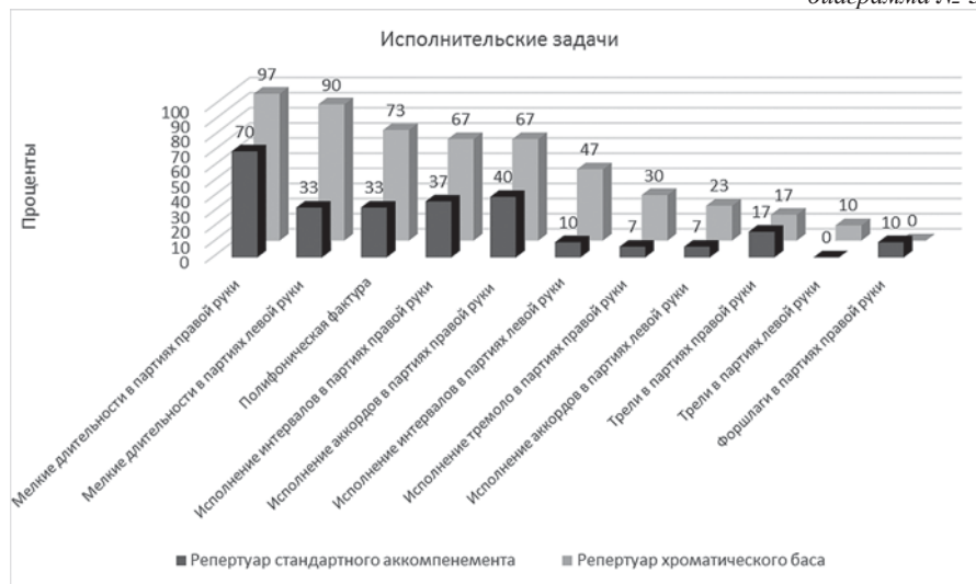
диаграмма № 3.

Технические трудности исполнения для разных типов инструментов распределены неравномерно. Можно отметить одну тенденцию: почти все они касаются репертуара хроматического баса. Это объясняется не только более совершенной в плане музыкальной выразительности левой клавиатуры, но и влиянием развития исполни-