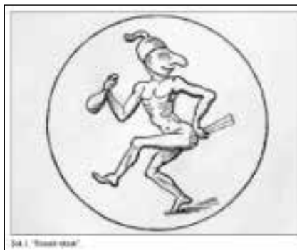
Рис. 1. «Римский шут»