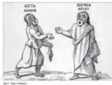
Рис. 3. «Гета и Демея»

пьесы, поставленные римлянами в популярных и грандиозных театральных сценах, представлений под открытым небом, одежда, грим актеров, используемые ими юмористические маски, каждое само по себе является уникальным образцом искусства, носящим сатирические элементы и отражающим качества, свойственные карикатуре, таким как преувеличение и критика.