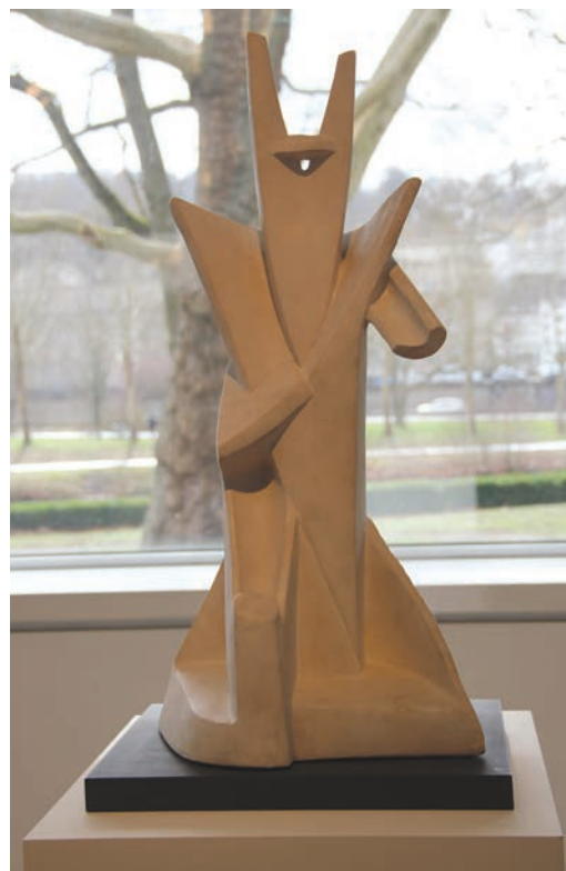
Рис. 2. Олександр Архипенко. Король Соломон. 1963. Гіпс. Саарланд Музей, Саарбрюкен (Німеччина). Saarländmuseum, Moderne Galerie, Saarbrücken.