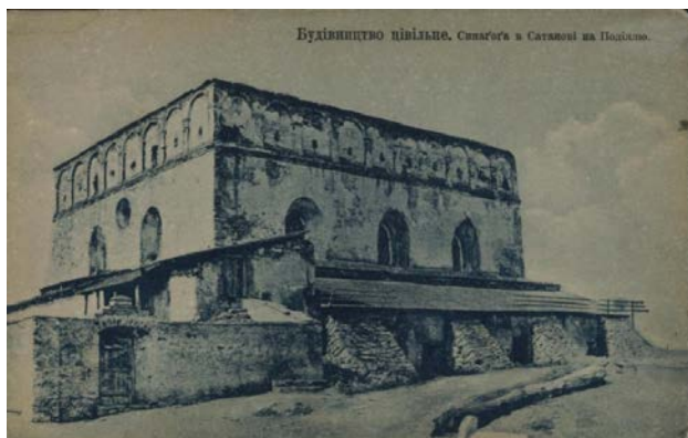
Рис. 7. Будівництво цивільне. Синагога в Сатанові на Поділлі. Коломия: Видавниче Т-во «Друкар» і «Галицька накладня», [1918].

Упродовж 1918–1919 рр. київське видавництва «Друкар» і «Галицька накладня» Я. Оренштейна надрукували понад 180 художніх поштівок у тематичному циклі «Українське мистецтво». Добірка серії «Будівництво цивільне» цього циклу складається з 15 художніх поштівок, що знайомили глядача з пам'ятками єврейської архітектури України XVI–XVIII ст.: оборонною синагогою в містечку Сатанові та заїздом у Фельштині (Монолатій, 2015: 158–160). Збудована в 1530-х рр., Сатанівська синагога мала вигляд невеличкого замку з високими мурами та міцним склепінням на вершці (рис. 7). Це склепіння ховалося за високими аттиком із маленькими стрільницями, а нижчі стіни мали великі вікна з напівкруглими верхами. Із західного боку вона мала прибудову для жіночого відділу.