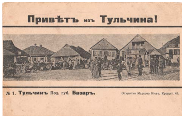
Рис. 4. Привіть із Тульчина! № 1. Тульчинъ Под. губ. Базаръ. Київ: Открытки Маркова, [1902].

Забудова Ринкової площі містечка Тульчин привернула увагу відомого київського видавця поштів Д. Маркова, який у 1902 р. розмістив її зображення на листівці «Привіт з Тульчина! Тульчин Под. губ. Базар» (рис. 4).