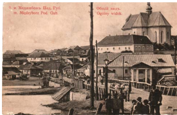
Рис. 5. м. Меджибож. Под. Губ. (m. Międzyborz. Pod. Gub.). Общій видъ (Ogólny widok). Каменець-Под.: Издание Г. Шпізмана (Wydania G. Spismana), [1913]. № 5.

На ній зображено головну вулицю Ді Брік (Мостова), що вела з передмістя Требухівці до Святотроїцького римо-католицького костелу, будинку Торгових рядів і Ринкової площі, між якою та скотським ринком розмістився квартал одноповерхових будинків єврейських ремісників і дрібних торговців. Заможні єврейські родини мешкали в одно- та двоповерхових кам'яних будинках на півночі містечка, неподалік фортеці.