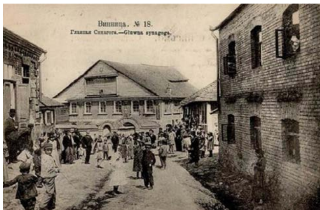
Рис. 3. Вінниця. № 18. Главная синагога (Główna synagoga).