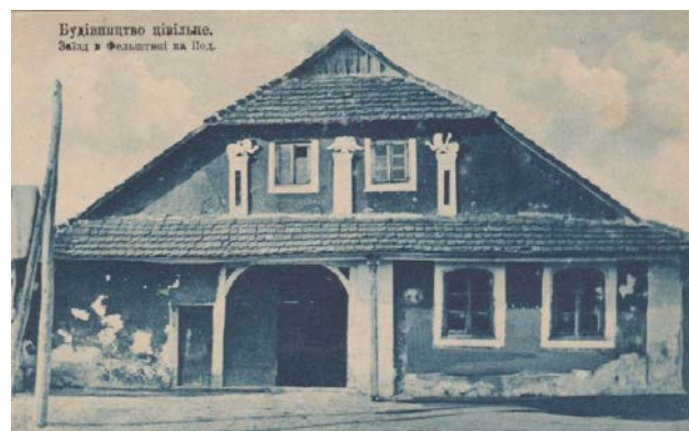
Рис. 8. Будівництво цивільне. Заїзд в Фельштині на Под. Коломия: Видавниче Т-во «Друкар» і «Галицька накладня», [1918]. Приватна колекція поштівок (м. Кам'янець-Подільський)

пощастило будівлі єврейської громадської лікарні в Балті. У 1902 р. єврейська громада Поділля ініціювала видання листівки «Єврейська лікарня» (рис. 9), на якій зображено учасників її урочистого відкриття в 1892 р. (Подольская губерния, 1892: 5) на фоні новозбудованої в класичному стилі будівлі.