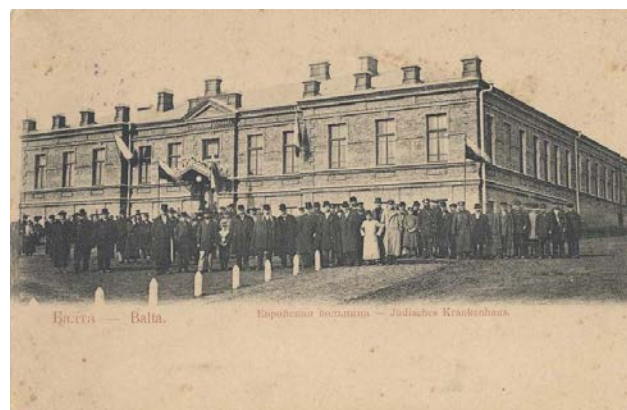
Рис. 9. Балта (Balta). Еврейская больница (Judisches Krankenhaus). Б.м.: Б.в., [1902].

Висновки. Отже, іконографічні матеріали, зокрема видові документальні листівки перших десятиліть 1900-х рр., мають важливе значення у вивченні етноконфесійної та культурної історії Правобережної України XVIII – початку ХХ ст. Вони дають змогу створити цілісну картину формування і розвитку єврейських дільниць міських поселень Східного Поділля за їх планувально-просторовими і стильовими характеристиками, сформулювати рекомендації щодо реставрації збережених і реконструкції зруйнованих єврейських архітектурних пам'яток, зокрема синагог, що були важливим елементом сакрального простору міст і містечок регіону нового періоду історії.