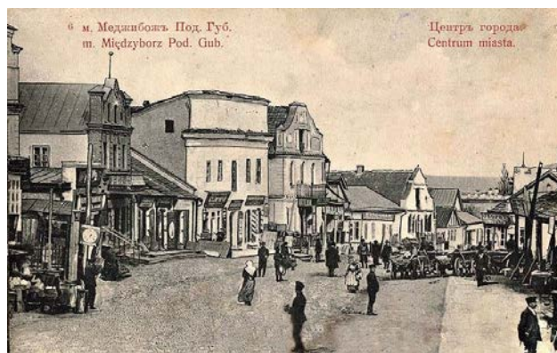
Рис. 6. м. Меджибож. Под. Губ. (m. Międzyborz. Pod. Gub.). Центръ города (Centrum miasta). Каменець-Под.: Издание Г. Шпізмана (Wydania G. Spismana), [1913]. № 6.

На іншій листівці цього ж видавця «м. Меджибіж Под. Губ. Вид міста» (рис. 6) зображено вимощену бруківкою центральну площу, периметр якої щільно забудований двоповерховими кам'яними будинками.