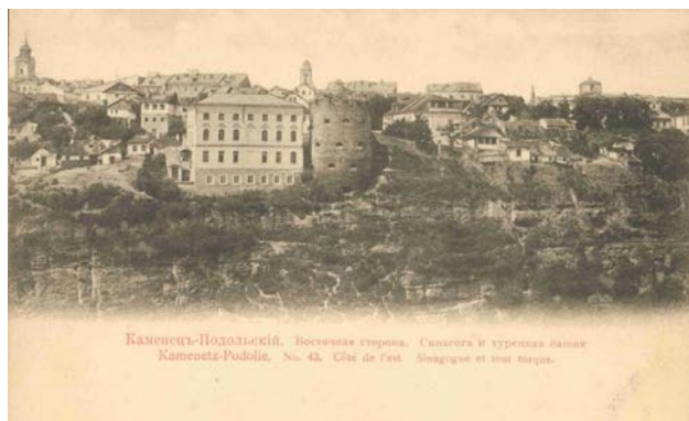
Рис. 1. Каме́нець-Подольський (Kamenetz-Podolie). Восточная сторона. Синагога и турецкая башня (Côté de l'est. Synagogue et tour turque). № 43. Б.м.: Магази́нь Варгафтига [1902].