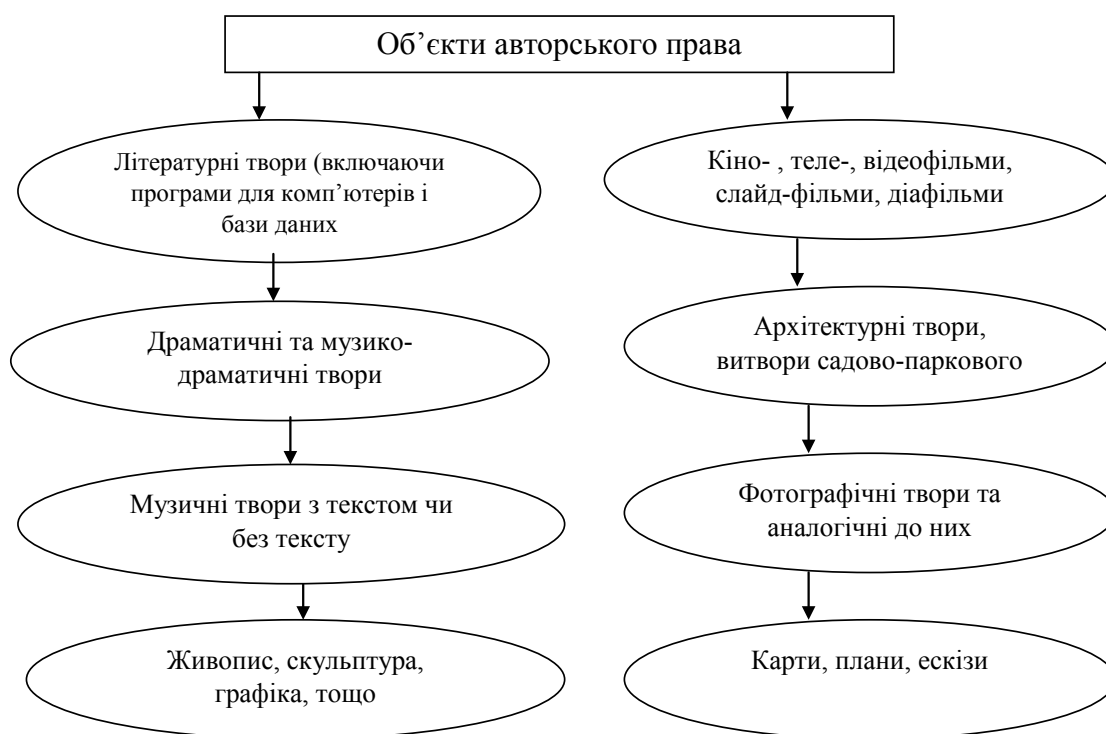
Рис. 1. Об'єкти авторського права

Україна, в свою чергу, також не стоїть на місці та, беручи приклад європейських країн, покращує законодавчу базу в галузі інтелектуальної власності й авторського права. Після проголошення Україною незалежності та прийняттям Цивільного кодексу України зросла потреба в покращенні важелів регулювання авторського права. Санкції в Україні за статтею 176 варіюються від штрафу в 115 євро до тюремного ув'язнення на термін до шести років. Офіційний збір за реєстра-