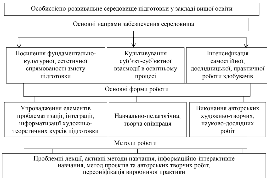
Рис. 2. Модель забезпечення освітніх компетентностей у підготовці здобувачів факультету музичної освіти

Третій напрям є інтегративним у контексті розвитку освітніх компетентностей здобувачів вищої освіти, оскільки спрямований на забезпечення їх художньо-творчими самостійними, науковими та практичними розвідками. Робота в даному напрямку зорієнтована на підготовку та педагогічний супровід виконання здобувачами творчих, наукових проєктів, що дозволяють розкрити свій творчий потенціал, виразити себе, побудувати свою «матрицю» освітніх компетентностей.