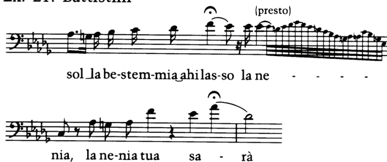
Рисунок 4. Виконання М. Баттістіні