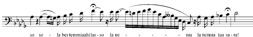
Рисунок 2. Оригінальна каденція з арія Макбета