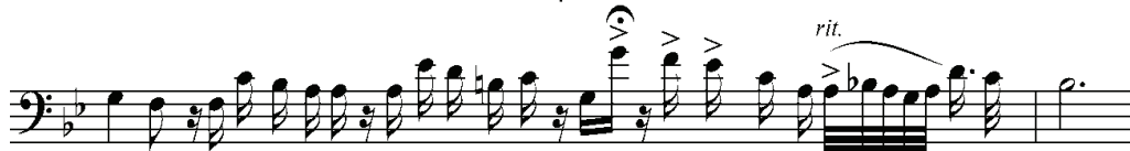
Рисунок 6. Виконання М. Баттістіні

pa tria... a te per du to ov'-e la pat ria col - col suo splen di do - av-ve - nir? rit.