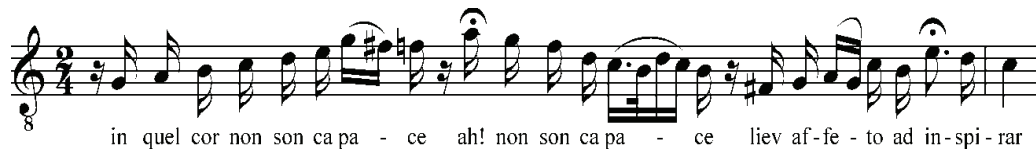
Рисунок 12. Виконання Л.Паваротті

в наш час можемо зустріти незначні елементи імпровізаційного характеру у вердіївських каденціях. Окремі каденції набули негласного статусу конвенційних і виконуються замість оригінальної, написаної італійським композитором. Втім, імпровізація шляхом широкого використання орнаментики в наш час загалом не характерна. Інколи в інтерпретації каденцій застосовують вставні високі ноти. В той же час існує напрям (котрий зокрема представляє Р. Муті) щодо точного слідування нотному оригіналу Дж. Верді, виконання виписаних композитором варіантів каденцій