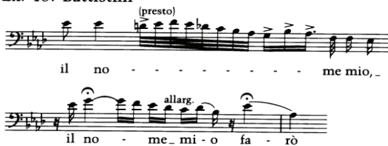
Рисунок 1. Оригінальна каденція з арії Карла та виконання М. Баттістіні