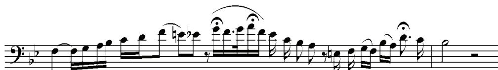
Рисунок 10. Виконання Е. Бастіаніні

sper - dail sole d'un suo sguar - do ah - la tempesta, la tempe - sta - del mio cor!