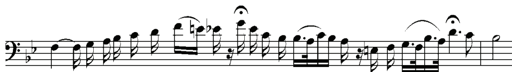
Рисунок 9. Оригінальна каденція з арії графа ді Луни

sper - dail sole d'un suo sguar - do ah - la tempe - sta, la tempe - sta del cor!