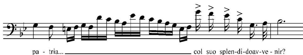
Рисунок 5. Оригінальна каденція з аріозо Ренато