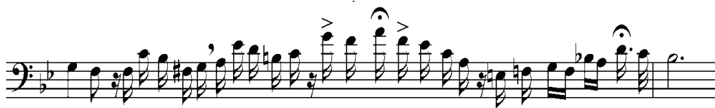
Рисунок 7. Виконання Тітта Руффо

patria... a te per-duto ov'-e la patria col suo splendi doav venir col suo splen - di - doavve - nir? _____