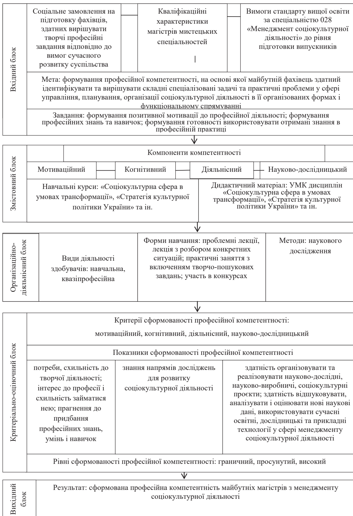
Рис. 1 – Компетентнісна модель підготовки здобувачів мистецьких спеціальностей (на прикладі спеціальності 028 «Менеджмент соціокультурної діяльності»)