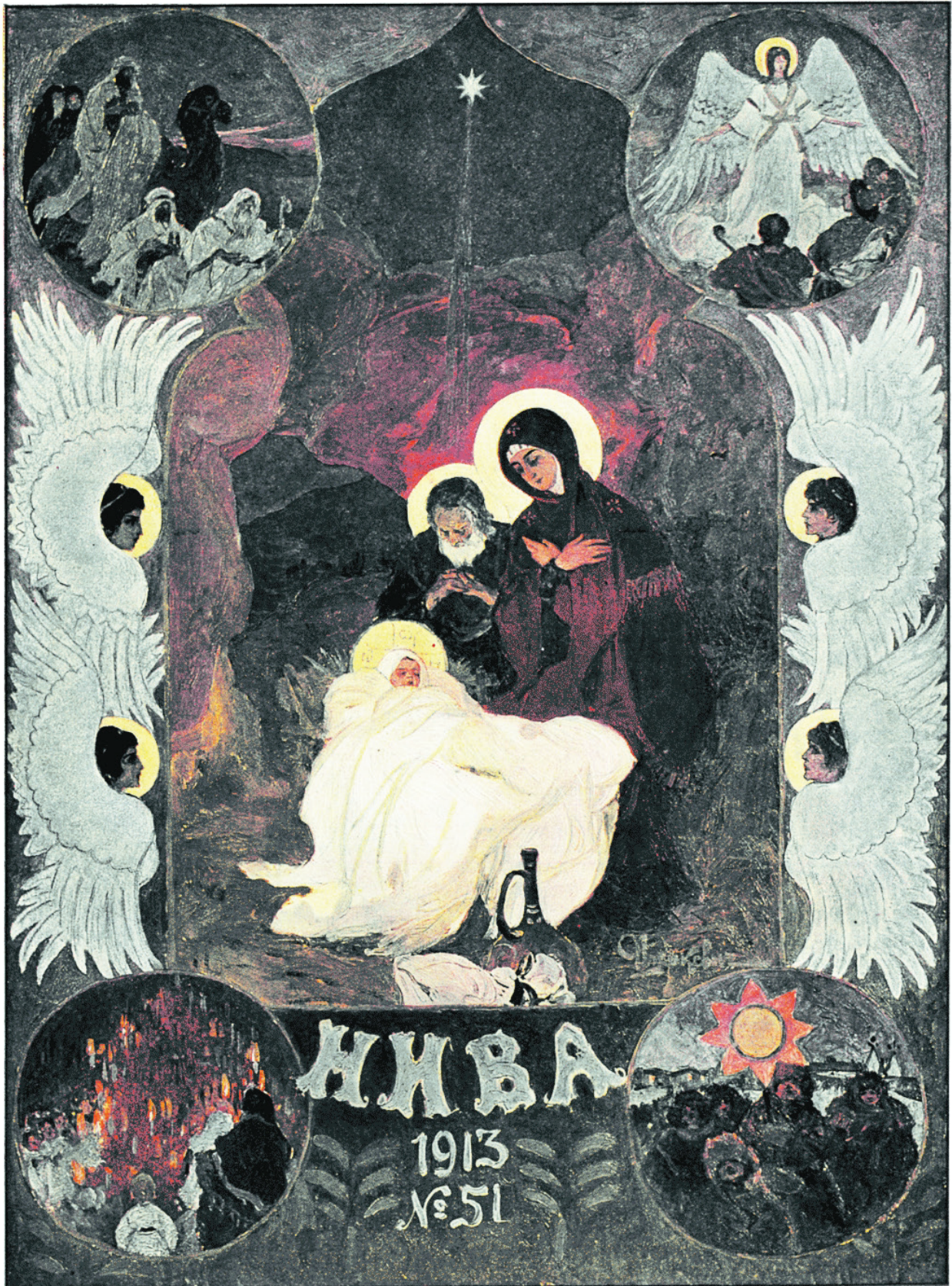
И. И. Ижакевичъ. Рождество Христово.

Рис. 2. Гравюра за рис. І. Їжакевича до журналу «Нива» 1913 р. «Рождество Христово». Кольорова автотипія (растрова цинкографія).