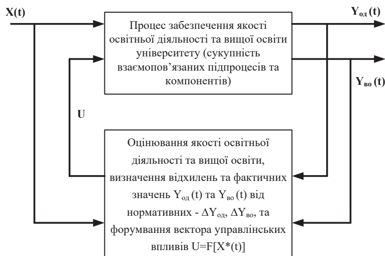
Рис. 1. Структура системи внутрішнього забезпечення якості освітньої діяльності та якості вищої освіти Львівської політехніки (Бобало, 2017: 12–27; Положення, 2017)

У 2019 р. ухвалою вченої ради університету затверджено стратегічний план розвитку Львівської політехніки до 2025 р. (Стратегічний план, 2019), місія та візія якого корелюються з політикою розбудови системи внутрішнього забезпечення якості освіти й освітньої діяльності університету. На виконання одного із завдань Стратегії