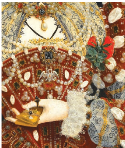
Рис. 4. Ніколас Хіллард. Портрет королеви Єлизавети I (Портрет пелікана), 1575. Деталь. Художня галерея Вокера, Ліверпуль

Образотворче мистецтво XV століття в Британії особливо насичене символікою пелікана, пов'язаною з правлінням королеви.