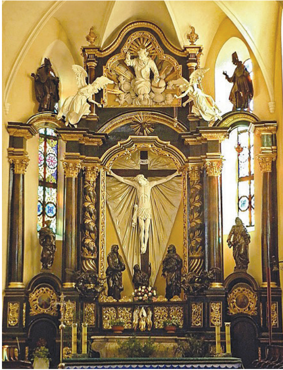
Рис. 6. Головний вівтар Петропавлівського костелу. Проект Яна де Вітте, 1742–1757 рр. Кам'янець-Подільський, Україна

костюлі Петра і Павла Кам'янець-Подільська в часи польської влади здійснено чергову реконструкцію. За проектом відомого інженера та архітектора Яна де Вітте (1709–1785) в 1742–1757 споруджено головний вівтар у бароковому стилі з елементами неоготики. Завдяки консервації костелу як музею атеїзму впродовж 60 років (із 1930-го) зберігся інтер'єр вівтарної частини з розп'яттям.