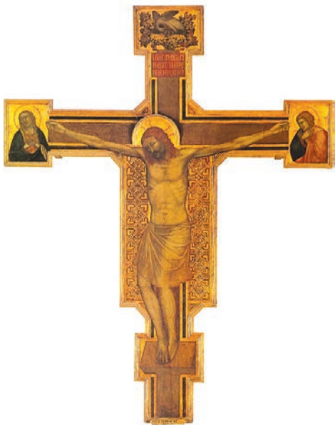
Рис. 1. Розп'яття з Богоматір'ю, св. Іоанном Євангелістом і пеліканом на верхньому кінці хреста, 1315. Зібрання Лувра

У зібранні Лувра зберігається масштабна робота, атрибутована бл. 1315 року, з одним із найбільш ранніх зображень пелікана в релігійному живописі – «Розп'яття з Богоматір'ю, св. Іоанном Євангелістом і пеліканом на верхньому кінці хреста». Пелікан, розташований на хресті над головою Христа, годує трьох пташенят своєю кров'ю. Його зображення досить міфічне, з великим химерно вигнутим тілом та крихітними крилами, що не здатні підняти їхнього власника над землею. Подібні трактування образу в мистецтві інспіровані уявою автора, який навряд чи бачив наживо овіяного легендами птаха.