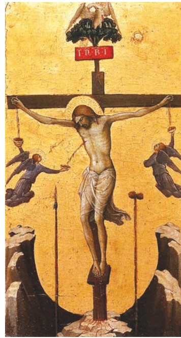
Рис. 2. Лоренцо Монако. Розп'яття з янголами, 1405–1410. Галерея Академії Флоренції

Пелікан як символ самопожертви трапляється в кількох роботах Лоренцо Монако (1370–1425). Одна з них – «Розп'яття з янголами», виконана на початку XV століття – композиційно нагадує вищезгадану роботу луврського зібрання.