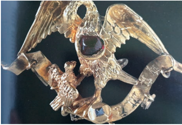
Рис. 3. Золота Бургундська брошка, XV ст., Бельгія. Золото, рубін, діамант

На грудях птаха встановлений рубін, що акцентує увагу на крові, якою годується немовля. Вишукана оздоба текстурована, щоб створити природне враження пір'я (Cherry, 2011). Пташеня зображене лише одне, на противагу встановленій традиційній трійці дитинчат, спирається на розгорнутий сувій із написом, що досі не розшифрований дослідниками. У центрі сувою виблискує діамант, привертаючи увагу до напису. Традиційно такі броші замовляли ювеліру для сімейних подарунків. Із високою вірогідністю можна припустити, що пелікан символізує реального батька, готового до самопожертви заради дитини. Цим же пояснюється неканонічна наявність лише одного пташеняти.