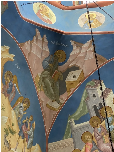
Рис. 4. В. Преображенський, В. Прокопчук. Апостол і євангеліст Іоанн Богослов. Розписи північно-східного паруса центрального купола. Червень – листопад 2017 р.