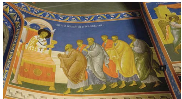
Рис. 6. Денниця. Причастя апостолів вином. Тасмна вечеря. Фрагмент. Розписи вівтаря. Червень – листопад 2017 р.

Розписи на стінах розташовані трьома регістрами. Верхній регістр займають поясні зображення праотців, старозавітних праведників, пророків, яких написали І. Бруховець, О. Поліщук і Р. Сазонов.