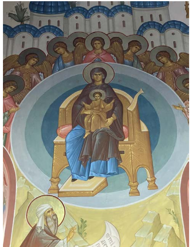
Рис. 7. Є. Ільїн. Про Тебе радіє. Фрагмент. Розписи хорів. Червень – листопад 2017 р.

Провідною тематико-сюжетною лінією храмової декорації є ушлявлення Пресвятої Богородиці. Її послідовно розкривають композиції, пов'язані з життєм і акафістом. Це – лики пророків і праведників, які свідчили про прихід Спасителя, а також царів, адже Діва Марія походила з роду пророка-царя Давида. Це – сюжети, що ілюструють Її народження, дитинство, введення у храм, Благовіщення, Її Успіння. Прославляють Царицю