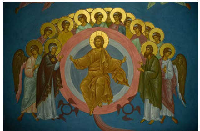
Рис. 8. В. Преображенський. Страшний суд. Фрагмент. Розписи західної частини церкви. Червень – листопад 2017 р.

Небесну Її зображення на троні із Христом Дитиною, розташовані в апсиді та на хорах. На хорах тема ушлявлення органічно проілюстрована акафістом, куди включені образи преподобних Печерських. Опосередковано ушлявленню Богородиці служать зображення Христа – Христа Еммануїла у вівтарі, «Різдва Христового» навпроти «Різдва Богородиці», зображення Заступниці за рід людський у композиції «Страшний суд».