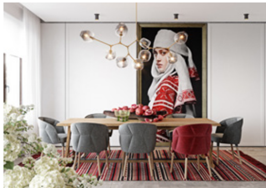
Рис. 6. Дизайн О. Касіяненко "BAGRYANY", 2018 р.

Отже, створюючи концепції на основі декоративного оздоблення інтер'єрів, маємо обережно та змістовно використовувати традиційні елементи, які притаманні українському житлу. Кожен елемент чи орнамент має бути застосованим відповідно до свого значення та не перенавантажувати простір, щоб інтер'єр не був схожий на музей.