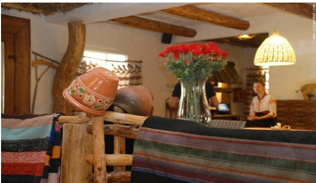
Рис. 7. Ресторан «Курінь» (м. Луцьк)

Загалом можна виділити два основні варіанти інтер'єрів, що використовують культурні традиції. У першому (класичному) варіанті створення художнього образу йде шляхом насичення внутрішнього простору традиційними елементами конкретно-історичного або збірного характеру. У другому варіанті просторового вирішення спостерігається інший підхід до дизайнерського трактування культурних традицій (Крилатова, 2013: 33).