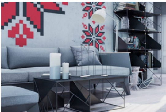
Рис. 5. Інтер'єр від дизайн-бюро "ODESD2", 2018 р.