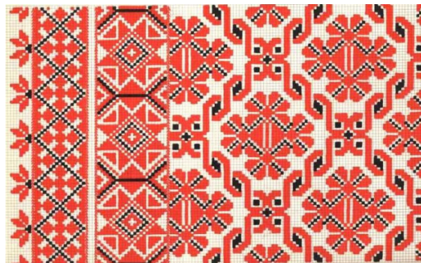
Рис. 2. Зразок геометричного орнаменту

Щодо символіки, яку сьогодні ми можемо трактувати лише гіпотетично, то ромбоподібні мотиви були символом зерна та родючості. Важливими були символи сонця як запорука життя і добробуту, а також крапка як знак води, крові й зерна.