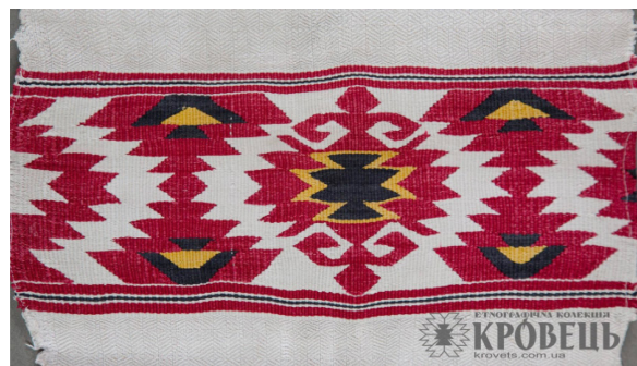
Рис. 3. Орнамент «у козака» на рушнику

Сьогодні ж цей орнамент має іншу назву, а саме «Берегиня», та символізує матір усього живого, богиню родючості, природи й добра.