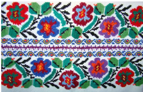
Рис. 1. Зразок рослинного орнаменту

В інтер'єрі поліської хати початку XX століття значне місце посідали прикраси з паперу, такі як квіти, фіранки, вінки, рельєфні «кружки» з концентричними смугами, якими прикрашали стіни, вікна, ікони. Серед декоративних традицій Полісся, як і інших зон України, чільне місце посідають космогонічні знаки та символіка, зокрема такі прадавні елементи, як кола, розетки, ромби, смужки та похрестя (рис. 2).