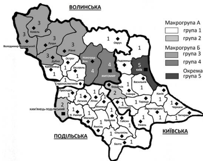
Рис. 3. Картограма динамічної моделі етнічного ландшафту Правобережної України (1867 – 1897)