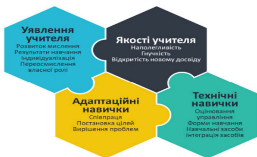
Рис. 1. Компетентність викладачів в умовах змішаного навчання

Для викладачів американських шкіл, які впроваджують змішане навчання, визначено перелік компетентностей, якими вони повинні володіти для організації ефективної роботи в межах змішаного інформаційно-освітнього середовища (Powell, 2014) (рис. 1).