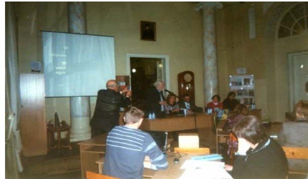
Рис. 2. Ювілейна конференція у Кременці, 2011 рік