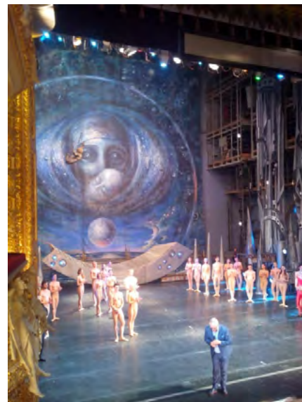
Рис. 2.b. Під час вистави «Створення світу» у Львівському національному академічному театрі опери та балету імені Соломії Крушельницької (фото А. Дем'янчука, 2017)

Споглядаючи живопис доцільно навести висловлювання композитора А. Петрова, який пригадуючи співпрацю з львівським сценографом Є. Лисиком сказав: «Чим більше я дивився виставу, тим більше мені подобались його декорації ... Він акцентував драматичні та філософські моменти балету і тим самим надав спектаклю ще більш значущого і об'ємного звучання». Цікавим є те, що музику до прем'єри цього балету у Львові композитор А. Петров написав за мотивами малюнків французького художника Жана Еффеля (Доманська, Проскураков, 1997: 23).