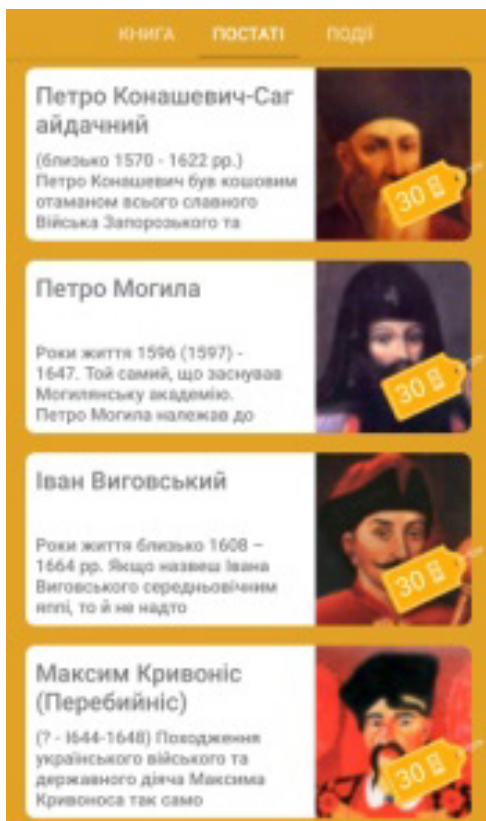
Рис. 1. Безкоштовний додаток РІД

Використовується для поповнення словникового запасу та вивчення маловживаних слів з української мови, а потім закріплення знань про історичні постаті та події (рис. 1). Може використовуватися в середніх та старших класах для дітей з порушеннями слуху та мовлення. Щоденно можна вивчити лише три слова, за що надається винагорода (піщинки), яку згодом можна обміняти на цікаву інформацію. Тож потрібно набратися терпіння і з цікавістю вчити колоритні українські слова.