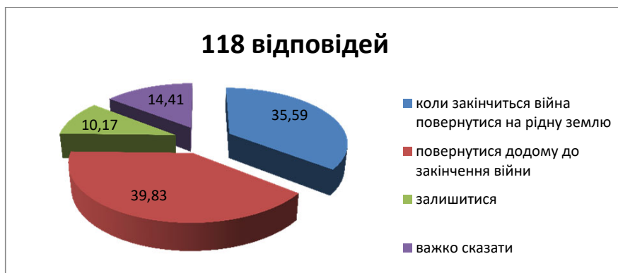
Рис. 5. Які думки супроводжують Вас зараз?

перші дні вивозили найдорожче (своїх дітей), щоб їх уберегти від війни яка, розпочалася 24 лютого 2022 року.