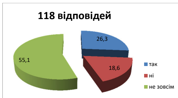
Рис. 3. Чи виправдалися Ваші очікування щодо підтримки українських сімей у Великобританії?

для того, щоб чогось добитися потрібно докладати максимум зусиль та постійно очікувати, повторно подавати та заповнювати анкети, бо часто приходять відмови. Для прикладу, є такі школи які дітей відразу взяли на навчання (залежно який район), а є такі, а що батьки очікують відповіді уже 2 місяці. А місцева влада не виділяє місць для дитини, або виділяє в тому районі досить далеко. При тому що через кожні 100 метрів інша школа. Можливо це зумовлено тим, що у Великобританії багато проживає людей і місць по школах не вистачає, і діти стоять в чергах, буває і таке, що очікують місць майже рік.