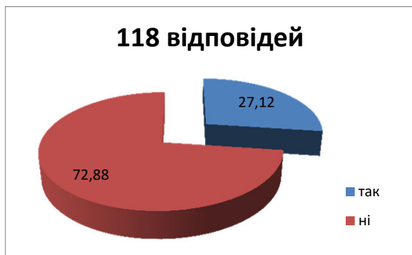
Рис. 2. Чи уся сім'я разом?

Як бачимо по результатах опитаних українських сімей у більшості не виправдалися очікування щодо підтримки у Великобританії (65 осіб), 31 особа цілком задоволена і 22 особи – ні. За словами опитаних більшість з них не задоволені підтримкою у Великобританії, зумовлено це тим, що