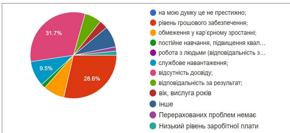
Рис. 2. Розподіл відповідей на питання «Що може стати на заваді у прийнятті рішення обрати посаду викладача (інструктора) іноземної мови у військовій частині НГУ?»