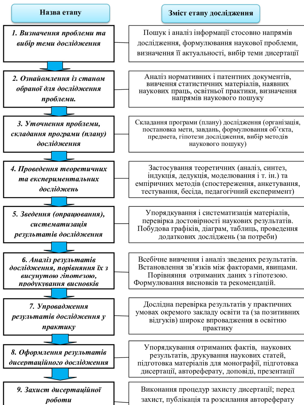
Рис. 1. Структурно-логічна схема етапів дисертаційного дослідження

викладачах загальноосвітніх дисциплін закладів професійної освіти з високим рівнем самоорганізації професійно-педагогічної діяльності та недостатнім рівнем їх підготовленості до творчого саморозвитку, неспроможністю усталеної роками методології підвищення кваліфікації забезпечити таку потребу; задовольняє запити освітньої практики у тому, що поки що вкрай обмеженим є наявне науково-методичне забезпечення процесу неперервного професійного саморозвитку педагогічних працівників; у педагогічній науці