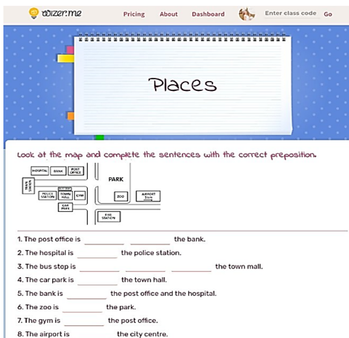
Рис. 2. Використання інтерактивного зошита при викладанні дисципліни «Іноземна мова»

Здобувачі освіти можуть стати більш залученими до навчання, якщо викладач використовує цифрові технології. Оскільки сучасна молодь уже досить звикла до використання електронних гаджетів, включення їх у навчання, безсумнівно, допомогло б викликати їх інтерес і підвищити рівень залучення. Інтеграція технологій в освіту забезпечує здобувачам цікавий досвід навчання, дозволяючи їм залишатися більш зацікавленими в дисципліні «Іноземна мова». Використання проекторів, смарт-дошок, дошок візуалізації, листів візуалізації може зробити навчання захоплюючим і розважальним для здобувачів.