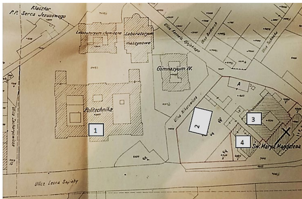
Фото 1. Ситуаційний план на березень 1928: 1 – головний будинок (корпус)

Беручи до уваги, що кілька разів згадувалися корпуси «Марії Магдалени» доцільно роз'яснити, що мова йде про приміщення колишнього монастиря домінікан поблизу костелу Св. Марії Магдалени, розміщеного неподалік Львівської політехніки (Див ситуаційний план – фото 1). З 1841 р.