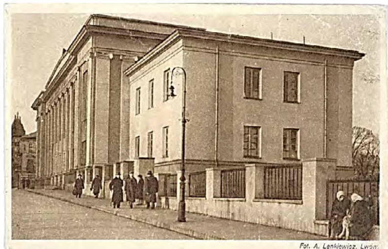
Фото 2. Бібліотека Львівської політехніки 1937 р.

тут розміщувався «Заклад кари» – в'язниця для жінок імені св. Марії Магдалени. Однак у 1923 році ці приміщення було передано Львівській політехніці і до 1928 року тривали ремонтні та інсталяційні роботи новоприєднаних корпусів. А з 1929/30 н.р. сюди переміщено частину кафедр Рільничо-лісового, Хімічного відділів та Відділу інженерії (Politechnika Lwowska. Rys historyczny, 1932: 14). В процесі будівництва бібліотеки постало питання про благоустрій за загальний вигляд ділянки, що тепер вже належала Львівській політехніці. На розібрання залишків мурів, проведення каналізаційних труб