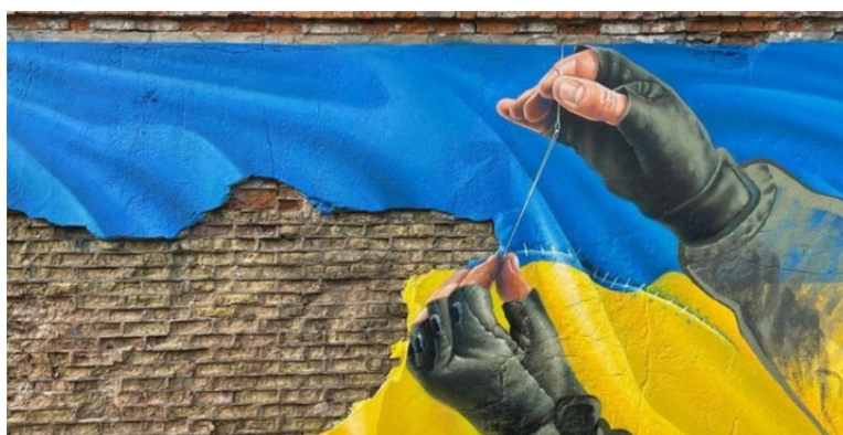
Рис. 4. Мурал. Воїн шиває прапор України. О. Корбан. Квітень 2022

яскравим кольоровим акцентом – синій та жовтий кольори державного прапора. Військовий намагається зшити прапор, що символізує об'єднання територіальної цілісності України, та відображає сучасну боротьбу країни з агресором. Кожен стібок у створенні цілісного прапора символізує внутрішню силу та наполегливість українського народу у прагненні зберегти свою незалежність та територіальну цілісність.