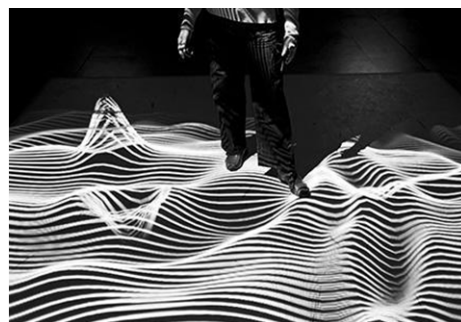
Рис. 1. Інтерактивна цифрова інсталяція “XYZT: Abstract Landscapes”, створена французькими художниками Адрієном Монтагудо та Клер Барро