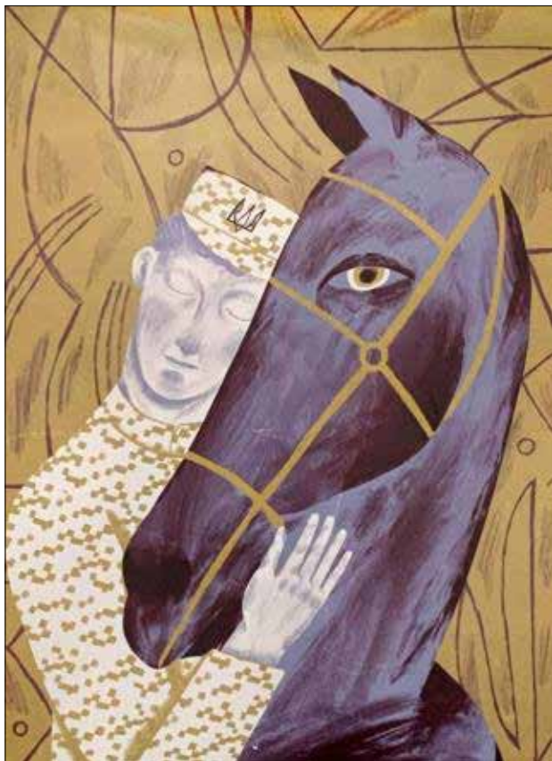
Рис. 6. Іпотерапія для поранених військових. Авторка – Дар'я Філіпова

українських військових, принижують представників країни-агресора, піднімають бойовий дух визволителів);