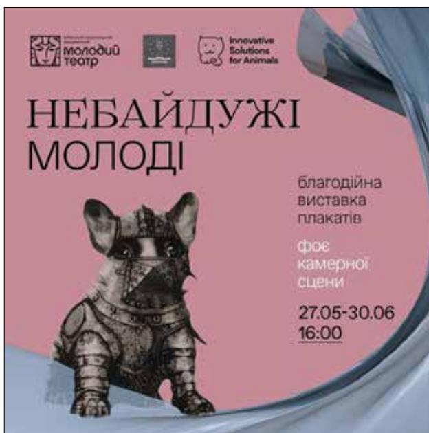
Рис. 1. Афіша благодійної виставки плакатів з використанням офорту викладача В. М. Снісаренка. 2023

Особливо хотілося б зосередитись на рисі, яка раніше привертала зовсім незначну увагу у