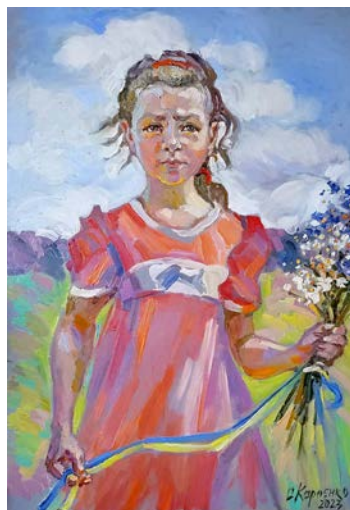
Рис. 3. Карпенко О. «Ніка. Богиня перемоги». Полотно, олія. 2023 р.

звучний колір та різкий контраст легко пробиває панцир байдужості та чіпляє душу гарячим звуком. Звичайно, є в портретному ряді і символічні образи, але їх смислове наповнення дуже просте. «Ніка. Богиня перемоги» (полотно, олія, 2023 р., рис. 3) – відсил до довоєнної плернерної безтурботної легкості, образ звичайного дівчиська, яке уособлює омріяну перемогу українського війська, немов нагадуючи, заради кого кожен батько йде на фронт, це персоніфікація цінностей кожної української родини, дівчинка, в руках якої букет польових квітів із жовто-блакитною стрічкою. Так, полотно сповнене символізму, – тривога в очах, не по-дитячому серйозних, кольори державного прапора на стрічці, але водночас це етюд, швидкий і легкий за палітрою та характером широкого, сміливого мазку. Наче згадка про минуле, але трактований образ уже інакше.