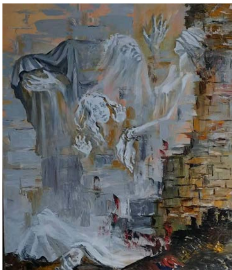
Рис. 4. Карпенко О. «Закатована Буча». Полотно, олія. 2022 р.

ються і кольорові спалахи, що одразу привертають увагу на тлі доволі монохромних композицій з переважно дуже динамічним, ламким ритмом. Так було з плямами червоного кольору: вони не можуть не нагадувати не лише кров, до якої напряму відсилає глядача автор.