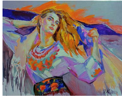
Рис. 6. Карпенко О. «Вільна». Полотно, олія. 2023 р.

від відблисків тривожності та полум'я, є певним пророцтвом, маніфестом українського мистецтва воєнних часів. А сама виставка вкотре привертає увагу спільноти до українського феномену, де художнє життя воєнного часу ґрунтуються на «трьох китах»: вижити, відродитися, перемогти.