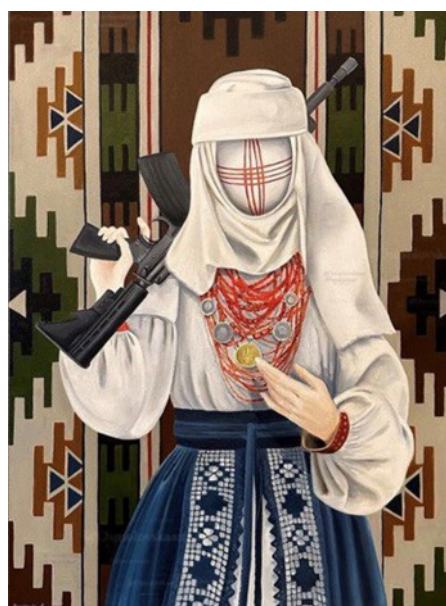
Іл. 11. А. Осмоловська, «Оберіг», полотно, олія, 70x50 см., 2023