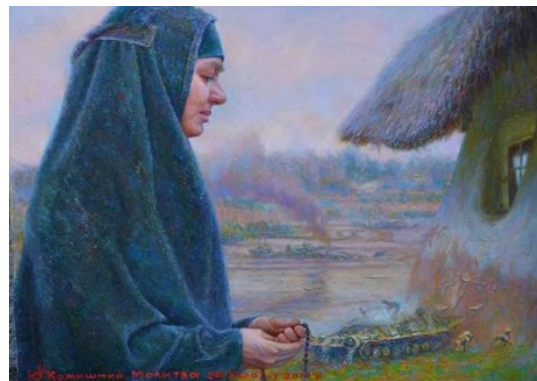
Іл. 2. Ю. Камішний, «Молитва за Україну», полотно, олія, 50x70 см., 2019