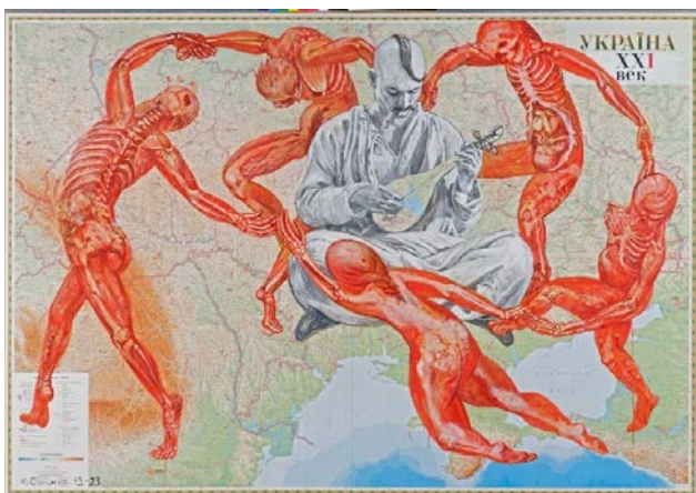
Іл. 7. Ю. Соломко, «Танок», двп, папір, офсет, акрил, 195х278 см., 2013–2023