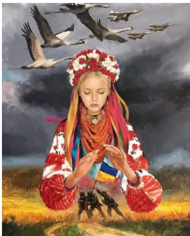
Іл. 1. О. Шекшуєв, «Берегиня», полотно, олія, 50x40 см., 2022

Висновки. Українські художники через академічне формотворення та алегоричні образи розкривають найрізноманітніші відтінки переживань і станів українського суспільства, яке зненацька опинилось посеред страшної війни. Твори, що можна віднести до власне батального жанру, які відображали б бої воїнів ЗСУ на передових фронтах, наразі не поширені, можливо тому, що в історії мистецтва минулих часів більшість художників були безпосередніми учасниками і свідками бойових дій, а зараз тим, хто на фронті захищає, не до художніх «одкровень». Попри те, сучасні художники правдиво змальовують те, що «вітає в повітрі», вони особисто відчувають і засобами мистецтва відтворюють усі загрози та виклики, що постають перед мирною людиною, змальовують наслідки руйнувань життів та міст, метафорично відображають становище України на геополітичній арені, але також намагаються підтримати дух співвітчизників та українських воїнів-захисників.