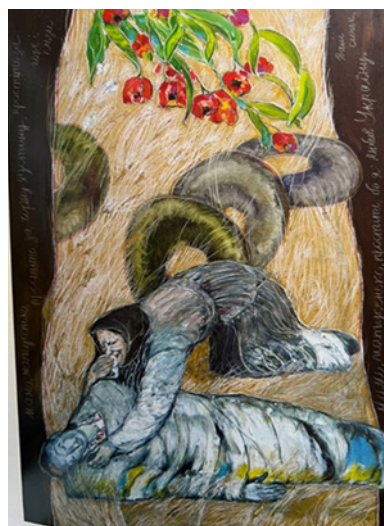
Іл. 6. В. Барінова-Кулеба, «Простіть, мамо, за чорну хустину», полотно, олія, 160х100 см., 2014–2015