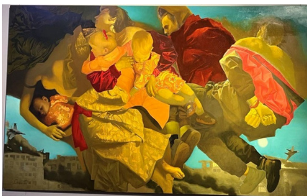
Іл. 5. Д. Доценко, «Український ренесанс», полотно, олія, 147х240 см., 2022