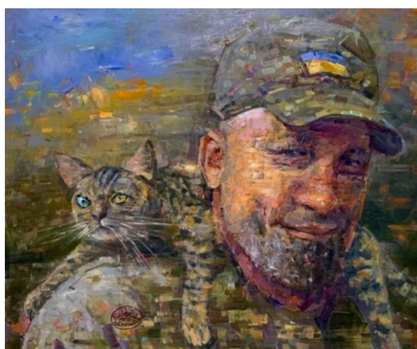
Іл. 12. В. Шерешевський, «Наші котики», полотно, олія, 60x70 см., 2022