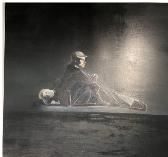
Іл. 8. В. Ткаченко, «02.05.22», полотно, олія, 2022