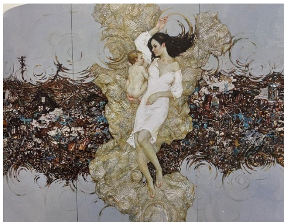
Іл. 3. Е. Андріанова, «Страшний сон», полотно, олія, 170x230 см., 2015