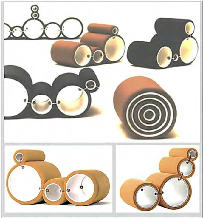
Рис. 4. Дизайн м'яких меблів-трансформерів «Крісло-трубка»; диз. Д. Коломбо. https://4room.ua/blog/dzho-kolombo-dizainer-futurist/

Висновки. Творчість італійського дизайнера, Джо Чезаре Коломбо, дозволяє стверджувати, що його інноваційні розробки меблів-трансформерів є й досі актуальними та естетично привабливими, не зважаючи на зміни в цьому напрямку, що сталися після 1970-х років. Розуміння дизайнера щодо створення житлового простору, який може поєднувати в собі робочі процеси з відпочинком та, за бажанням мешканців, змінювати функціонально-планувальне рішення, вказує на глибокі професійні знання автора дизайнерських розробок, які допомагають йому в реалізації різноманітних інновацій. Серед основних визначено: 1) зміни функціональних процесів в окремо обраному моноблоці корпусних меблів; 2) можливості різноманітних