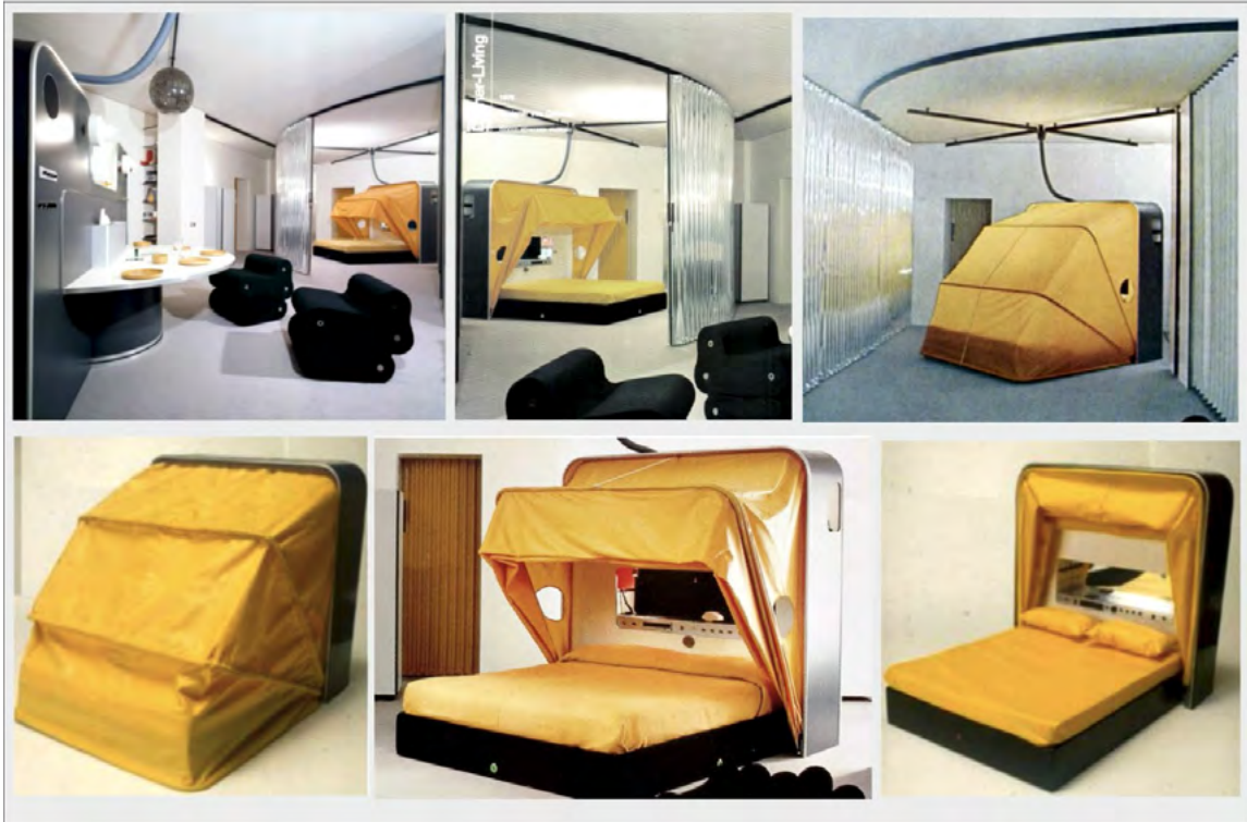
Рис. 1. Дизайн квартири в м. Мілан (Італія); дизайнер Джо Коломбо. Спальне місце “Cabriolet Bed”, 1969 рік. http://www.designstory.ru/news/view/3889

положні для дизайну 60-х і 70-х років. В той же час, у 1963 році, дизайнер створює динамічний багатофункціональний моноблок за назвою «Minikitchen», за що отримує срібну медаль на XIII Triennale. За висловленням автора кухонного моноблоку: «Речі мають бути гнучкими... Мою кухню можна переміщати по кімнаті або виносити з неї, і коли ви закінчите з нею, вона закриється, як коробка» (MoMA). Дизайн таких меблевих моноблоків включає наступне: холодильник, дві конфорки, обробну дошку, дрібну побутову техніку, багатофункціональні відсіки для дрібних кухонних приладів, розетку для дрібної побутової техніки. Отже, створення кухонного моноблоку “Minikitchen” вказує на одну з головних концепцій Д. Коломбо, в якій дизайнер пропонує створювати автономні меблі-трансформери для будь-якого житлового простору за принципом інтегрування.