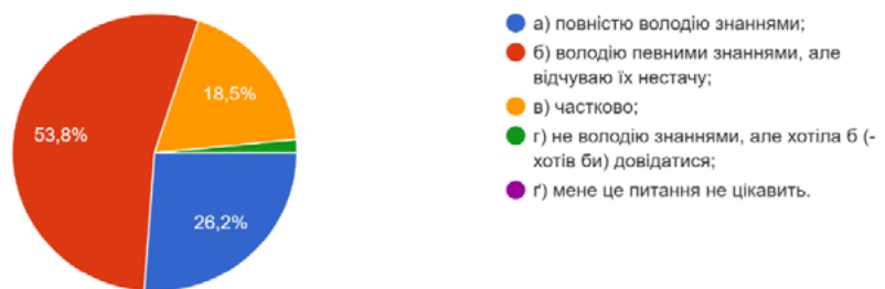
Рис. 1. Рівень знань вихователів про здоров'язбережувальну діяльність у ЗДО