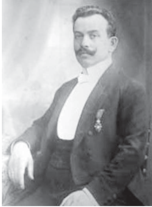
Якуб Файерштайн (Портрет невідомого автора. Дрогобич, 1910 р.) та особистий підпис від 26 грудня 1912 р.

Був чоловіком упертим, в розмові доступним не для кожного, особливо для тих, хто виходив за межі його власного «Я» [23, 3–4]. Його потужний нафтовий капітал працював «виключно на його ім'я, гонор, авторитет і бажання управляти усім» [23, 4]. З його діяльністю пов'язують зародження авторитаризму в середовищі магістрату та інших державних інстанцій міста, підкуплених «вовчою клікою Файерштайна» [23, 4]. Скажімо, впродовж 1909 – 1914 рр. голосування щодо бургомістра залежало, в основному, від волі Я. Файерштайна, оскільки його політична група обіймала більшість магістрату. Добре відомо, що чиновників різних державних інституцій міста, які не влаштовували Я. Файерштайна і його нафтову промислову групу, швидко усували з посад [5, 658]. У