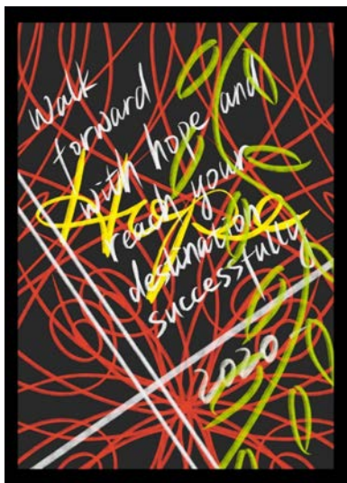
Рис. 5. Ідіть вперед з надією, і ви досягнете успіху. Іюан Дінг. Італія

Дизайнери вибирають шрифт і способи акцентування, які допомагають прискорити процес сприйняття інформації і направити її до самої суті. Акцентування може бути реалізовано за рахунок ряду графічних прийомів: виділення положенням у слові або тексті, контрастування шрифтових знаків, застосування колірною або різнофактурного ефекту, введення зображення предметів замість окремих літер. Приклади даного використання часто зустрічаються у шрифтових плакатах екологічного спрямування.