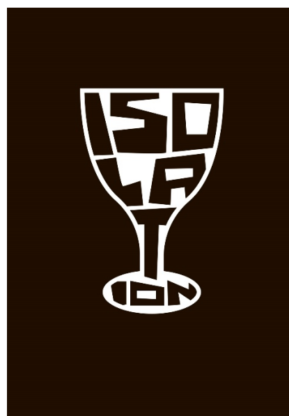
Рис. 4. Ізоляція. Войцех Мазур. Польща

Ще один зразок того, як типографіка створює форму предмету, можна спостерігати в плакаті польського дизайнера, де слово «ізоляція» набуває форми келиха. В умовах невизначеності та тривожної інформації при пандемії «ковід», коли змінились економічні та соціальні відносини, сталося погіршення форм життя населення, серед яких найбільючішою виявилася суворі ізоляція та її наслідки. Дизайнери констатують факт дедалі більшої та небезпечної статистики споживання алкоголю з метою позбутися самотності, нудьги та екзистенційних страхів, і демонструють виразні ілюстровані твори, де шрифтова композиція виступає змістовним зображенням (рис. 4).