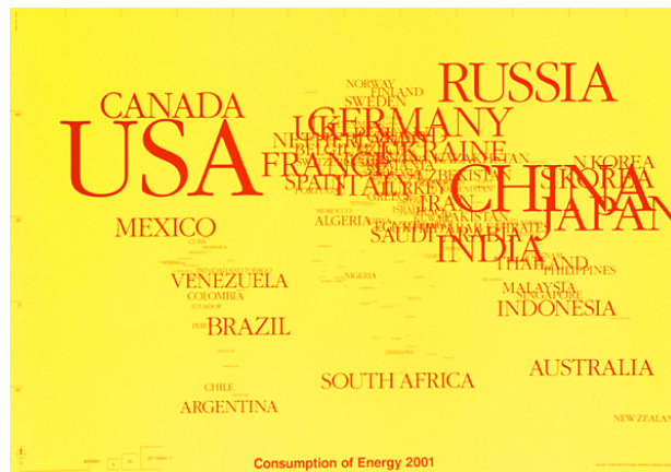
Рис. 3. Споживання енергії. Ю. Такада. Японія

«комфорту» людини. Створюючи багатшарову динамічну структуру за допомогою шрифту, дизайнер висловлює стурбованість тим, що енергетичне споживання у світі чутливо впливає на екологічні системи.