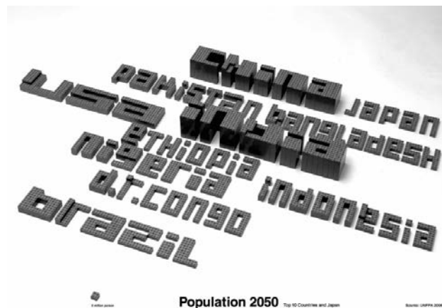
Рис. 9. Популяція 2050. Йокіші Такада. Японія

дизайнером Йокіші Такада (рис. 9). За даними ООН на сьогодні найбільша у світі держава за чисельністю населення – Індія, на другому місці після неї – Китай, після розпаду СРСР третіми стали США, Індонезія та Пакистан займають четверте та п'яте місця, Нігерія, Бразилія, Бангладеш займають шосте, сьоме і восьме місця відповідно. Кожна з наведених країн на плакаті має вигляд будови з безлічі одиниць пластмасового «лего». Будови наділені глибиною, об'ємом та тінню. За одиницю виміру взято найменший елемент конструктора «лего» – у лівому нижньому кутку плакату позначено, що кожна одиниця конструкції дорівнює двом мільйонам людських осіб. Чим більше населення, тим більш об'ємною виглядає назва країни. Сегменти, з яких складаються літери, формують моноліт пластмасових блоків. Даний приклад комбінування графічних елементів для пояснення теми є переконливим. Візуалізована інформація легка до сприйняття. Автор досягає мети інфографіки – проінформувати та зробити перегляд цікавим.