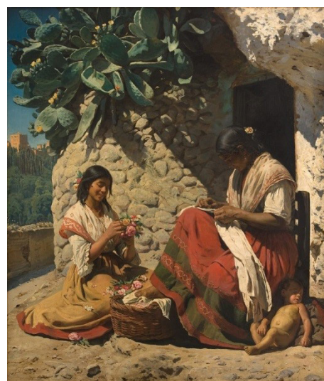
Рис. 5. Педер Северин Кройер «Дві циганки біля своєї хижі», 1878

Робота Педера Северина Кройера «Дві циганки біля своєї хижі» (рис. 5) також підтверджує думку про те, що діти як кочових, так і осілих циган зростали, інстинктивно цілком підлаштовуючись під уклад життя родини, роду, табору або поселення. Робота, в якій центральну роль посідає невимовна сонячність, представляє двох циганок, одна з яких робить букети з живих квітів, а інша вишиває. Поруч з останньою, розніжившись під гарячим сонцем, притулившись до спідниці матері, на землі спить голе немовля, яке виглядає щасливим та умиротвореним, зростаючи в єдиному ритмі з життям циганської общини.