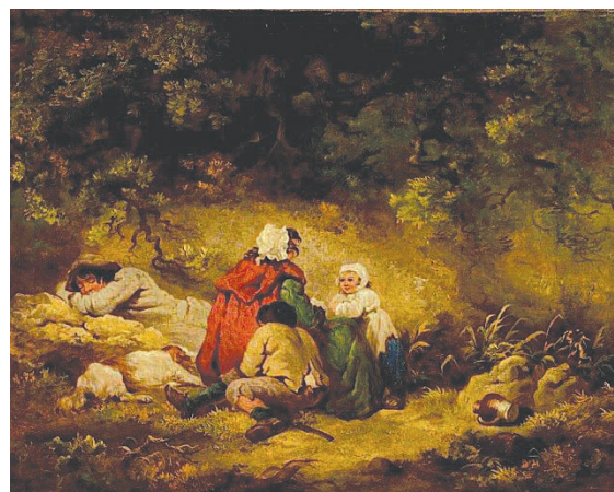
Рис. 7. Джордж Морланд «Циганський табір», 1790–1804

Окремо варто описати роботи, в яких відображені сцени табірної життя, які не лише демонструють стосунки між матір'ю та дітьми, а й допомагають осмислити родинну й табірну ієрархію циган, їхній побут. Як-то, в роботі Джорджа Морланда «Циганський табір» (рис. 7), де представлена родина, яка відпочиває на лісовій галявині. Ліворуч зображено сплячого батька, по центру – мати, яка сидить спиною до глядача. На її колінах, обличчям до матері сидить донька, а за материнською спиною – хлопчик у рваних штаних та кожусі. Зовнішній вигляд родини свідчить про невеликі статки, але їхні пози та емоції дівчинки промовляють про довірливі стосунки між матір'ю та дітьми. Як і про те, що в циганських родинах вихованням дітей займалась переважно жінка. І якщо чоловік через певні обставини втрачав доходи, вона також і утримувала сім'ю, займаючись ворожінням або жебракуванням. Оскільки ці професії в системі занять були суто жіночими.