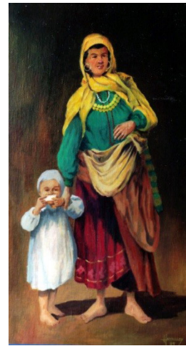
Рис. 9. Георгій Гаврилай «Циганська мати з дитиною», 1989

Висновки. У статті проаналізовано та аргументовано інтерес художників доби Відродження – кінця ХХ століття до теми ромського материнства. З цією метою охарактеризовано роботи Марджорі Френсіс Бруфорд, Девіда Вілкі, Георгія Гаврилая, Франса Галса, Чезаре Аугусто Детті, Педера