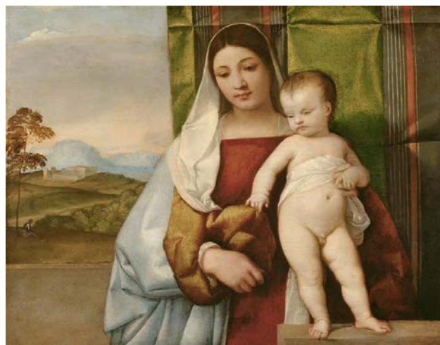
Рис. 2. Тиціан «Циганська Мадонна», 1510–1511

червоний колір сукні молодої матері. У її постаті вбачається достоїнство та спокій, які є опорою для маленького сина, який нещодавно почав ходити та однією рукою тримається за руку Мадонни, а іншою допитливо торкається до тканини на її правій руці. Цим самим материнська поза відображає готовність не лише підтримати свою дитину у випадку її слабкості, а й показати оточуючий світ. Художник за допомогою витонченого ліричного колориту з переважанням світлих відтінків зеленого, бежевого, сірого й коричневого кольорів тла підкреслив поетичну материнську ніжність.