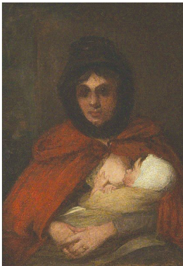
Рис. 3. Девід Вілкі «Мати-циганка», I половина XIX ст.

зображенням ромських матерів. Однією з найвідоміших є робота іспанського художника Мурільйо «Циганка з хлопчиком». На картині представлена молода циганка в яскравому одязі, яка обіймає свого малолітнього сина. Його обличчя приховане в її одязі, проте сама поза передає теплоту, любов і довірливі стосунки між матір'ю та дитиною.