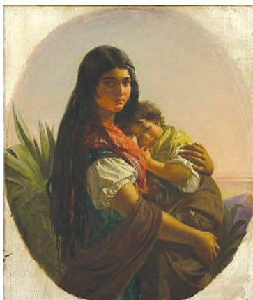
Рис. 1. Джон Філіп «Іспанська мати-циганка», 1852

Так, на сайті Royal Collection Trust – благодійного фонду, який опікується колекцією творів образотворчого й декоративно-прикладного мистецтва британської королівської родини, частина творів присвячена темі ромського материнства, кожен із яких детально охарактеризований. Як-то, робота авторства Джона Філіпа «Іспанська мати-циганка» (рис. 1).