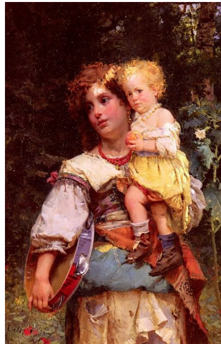
Рис. 4. Чезаре Аугусто Детті «Циганка з малям», 1877

Значно життєрадіснішим та більш романтизованим є портрет циганки з малям, створений Чезаре Аугусто Детті (рис. 4). Художник досяг цього завдяки світло-тіньовим експериментам – особливо, на обличчях та волоссі. Образ матері, яка тримає в одній руці дитину, а в іншій барабан, є підтвердженням того факту, що ромські жінки вміло суміщали дві місії – виховання дітей та заробітки, до чого діти з раннього дитинства були залучені, зростаючи в гармонії з діяльністю родини й життям табору. Але не варто забувати й про намагання соціуму вберегти дітей, про що свідчить наступне повір'я: «Кана ашарен ле чаворес ода ко вакерел, трівал чунгарел аври, гой ле чаворес те наден якхгало. Коли кажуть щось добре про дитину, той, хто каже, тричі спльовує, щоб не зурочити» (Навроцька, Човка та ін., 2017: 17).