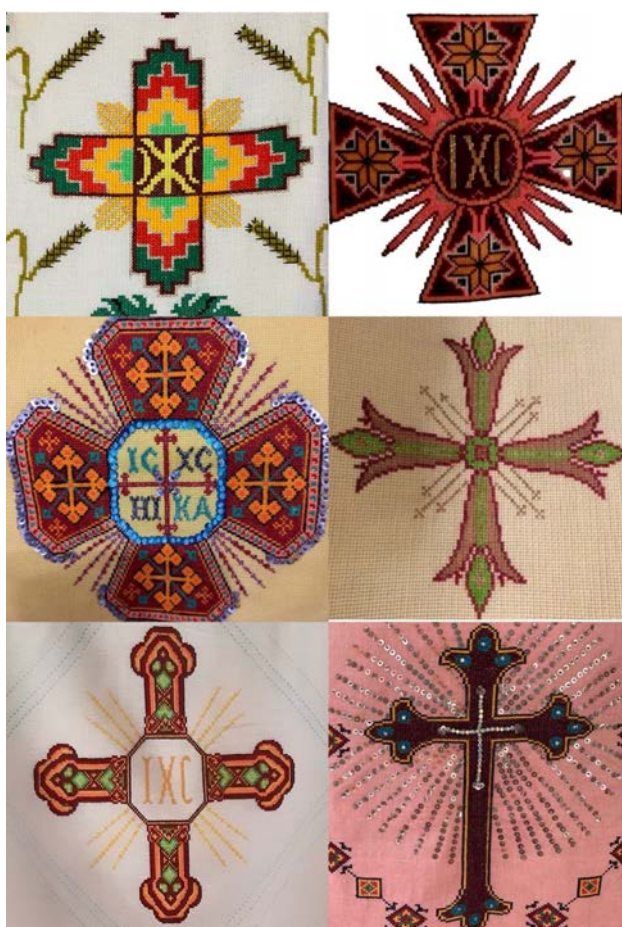
Рис. 1. Графічні види хрестів

Поряд із зазначеними мотивами виступає коло, яке виконується як з чітко окресленими контурами, так і у формі, утвореній поєднанням різних елементів. Крім цього, форма кола не мала самостійного значення та як й інші вищезазначені мотиви, поєднувалась із хрестом, ромбом та інколи – з квадратом. Також варіант кола простежується, як рамка для сюжетної композиції на опліччі фелона (рис. 2).