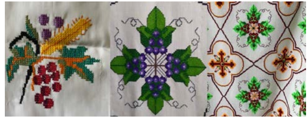
Рис. 3. Мотив винограду

На виявлених зразках священничого одягу зустрічаються різні варіанти мотиву «винограду». Так, на фелонах із Франківщини, Тернопільщини та Львівщини (рис. 3) стилізовані листки й грона винограду укладені у форму хреста, або в букетики, які розміщуються по всьому полотнищу, тоді як низ оформлений виноградною стрічкою. Сама стрічка утворена з листків та кольорових (червоних, фіолетових, вохристих та синіх) грон винограду, які чергуються між собою.