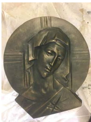
Іл. 4. Зображення Богоматері, бронза, поч. XXI ст.