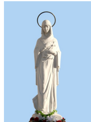
Лл. 2. Скульптура Матері Божої, мармур, поч. ХХІ ст.

Богородиця у творчості І. Семака представлена у різноманітних жанрових варіантах, від станкових камерних скульптурних творів, до монументальних фігур Матері Божої у контексті архітектурно-просторового ландшафту. Образ Марії з похилою головою зі спадаючими складками одягу на тлі німбу наповнений тривожним передчуттям (Лл. 2). Іншим, сповнений смутку, є образ Марії, яка немов перебуває у коконі власних переживань і от от зронить сльозу. Скульптурний твір «Ікона», є своєрідним перетворенням іконного площинного зображення Богородиці з Ісусом у об'ємний скульптурний пластичний станковий твір (Лл. 3).