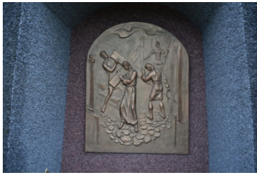
Лл. 7. Фрагмент Хресної дороги, бронза, 2014 р.

свого роду «Опус Магнум», тобто одна з кращих, найбільш амбітна, скульптор розпочав 2014 року (Лл. 7–10).