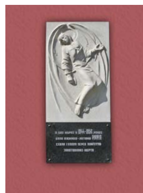
Іл. 6. Стелла «Ангел», мармур, поч. XXI ст.

Образ знесиленого ангела використав скульптор на меморіальній дошці закатованим жертвам на мурах в'язниці-катівні НКВД у Калуші. Скорботна фігура ангела є центральною у композиції стелли-пам'ятника примусово вивезеним 1951 року енкеведистами мешканцям с. Кадобна. Сільська церквиця і журавлі що відлітають, посилюють образну ідею цього скульптурного твору (Іл. 6).