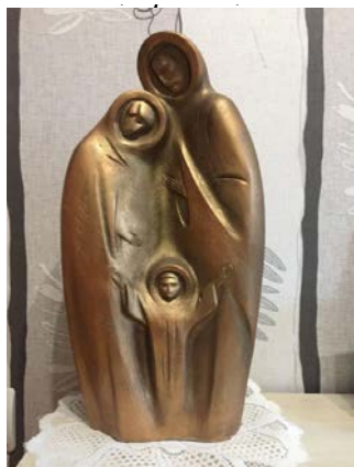
Іл. 5. Скульптура «Троє», бронза, поч. XXI ст.

Вагоме місце у сакральній тематиці скульптурних творів І. Семака посідає образ ангела. Такі роботи як «Галицький ангел», «Калуський ангел» промовисто засвідчують усвідомлення автора про потребу захисту і опіки як усієї України, так і рідної землі малої Батьківщини. Калуський ангел, до прикладу, дзвонить у дзвони, закликаючи люд до боротьби зі злом, немов відсилаючи одночасно глядача до спогадів про славетну ліярню дзвонів братів Фельчинських у Калуші. Велична фігура