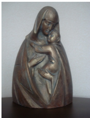
Іл. 3. Скульптурний твір «Ікона», бронза, поч. XXI ст.