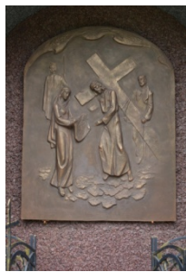
Лл. 9. Фрагмент Хресної дороги, бронза, 2014 р.