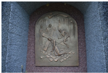
Лл. 8. Фрагмент Хресної дороги, бронза, 2014 р.