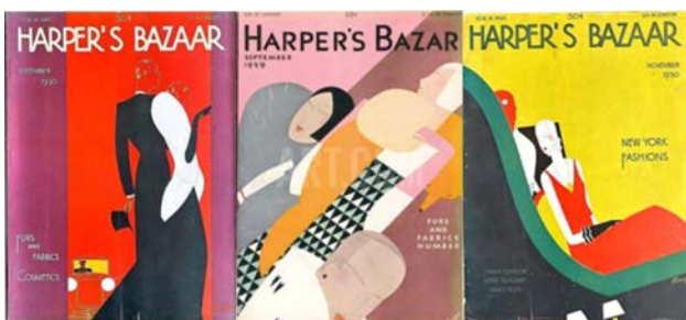
Рис. 9. Обкладинки Harper's Bazaar. Авт. Леон Беніньї (Léon Bénigni) 1929–1930 рр.

Обкладинки авторства Едуардо Гарсія Беніто 1920-х років (рис. 7) вирізнялися лаконізмом площинних силуетів та насиченою тональною палітрою. Пізніша графіка також французького автора Вільяма Боліна 1927–1930 років (рис. 8) тяжіла до динаміки та ритмізації форм, використання патернів. А обкладинки Harper's Bazaar, що розробив Леон Беніньї в 1929–1930 роках, поєднують в собі чисті насичені тони, використання тонкої плавної лінії в силуеті, патерни з трикутників та хвилеподібні ритмічні повтори (рис. 9).