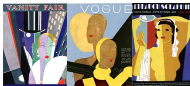
Рис. 6. 1) Обкладинка журналів: «Vanity Fair». (Дизайн обкладинки Едуардо Гарсія Беніто (Eduardo Garcia Benito). Голлівуд, США, 1928. 2) Vogue, (Дизайн обкладинки Едуардо Гарсія Беніто (Eduardo Garcia Benito), Франція, 1930. 3) «Gebrauchsgraphik» (Дизайн обкладинки Джозеф Біндер (Joseph Binder) Німеччина, 1931. https://i.pinimg.com/736x/c1/35/d8/c135d869836d4f6e5cac8ab89b106d9f.jpg https://hprints.com/s_img/ng_md/48/48046-vogue-paris-1931-february-benito-paul-poiret-marie-laurencin-madame-louis-cartier-chanel-george-ba3ba2e3b5b0-hprints-com.webp https://www.antipodean.com/pages/books/26454/poster-art-hk-frenzel/gebrauchsgraphik-international-advertising-art-monthly-magazine-for-promoting-art-in

Таким чином можна зробити висновок, що графічні засоби – зокрема використання пластичної лінії та плями, простих геометричних форм – були подібними незалежно від регіону, а вплив мистецтва Західної Європи на графіку Львова є очевидним.