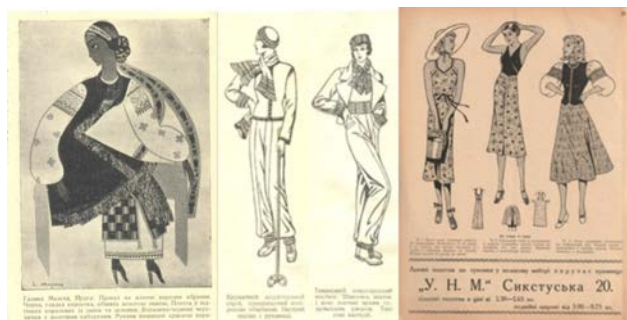
Рис. 4. Графіка в журналі Нова хата. Львів. 1934. № 3, 1, 13–14.

На рис. 3.3 бачимо трактування модельних постатей у традиційному вбранні нареченої і заміжньої жінки. Графічні зображення передають скромний та стриманий жіночий образ, таким способом виражаючи специфіку української культурної ідентичності, Галицької зокрема.