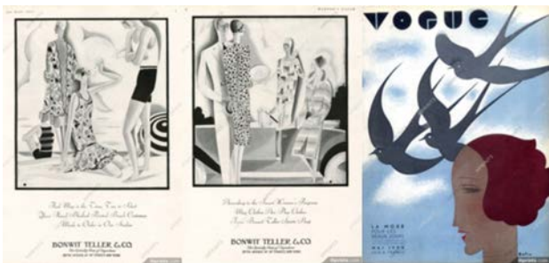
Рис. 8. Роботи Вільяма Боліна Боліна (William-Bolin) 1927–1930 рр. Франція https://hprints.com/en/search/William-Bolin/