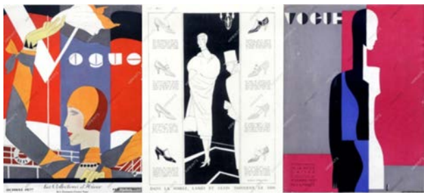
Рис. 7. Роботи Едуардо Гарсія Беніто (Eduardo-Garcia-Benito) 1920-ті рр. Франція https://hprints.com/en/search/Eduardo-Garcia-Benito