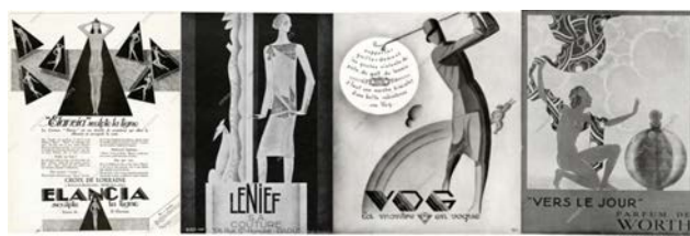
Рис. 10. Ілюстрації у французькій періодиці 1927–1930 років.

Змістовно ілюстрації європейських періодичних видань передавали ідею більш розміреного способу життя: спорт, театр, висока мода, естетика побуту та дизайну інтер'єру (рис. 10). Натомість українська графіка формувала більш стриманий образ із національним характером, що символізував боротьбу, опір, стійкість і внутрішню силу.