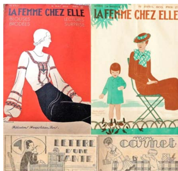
Рис. 5. Обкладинки жіночого журналу «La Femme Chez Elle» та ілюстрації з жіночих журналів. Авт. Б. Бокур (B. Baucour), 1930-ті рр. https://nouvellesuzette.canalblog.com/archives/2010/05/05/6138299.html

В представлених зразках обкладинок Vanity Fair, Vogue, та Gebrauchsgraphik характерним способом трактування жіночого образу є використання геометричних плям з поєднанням тонкої ламаної та хвилеподібної лінії (рис. 6).