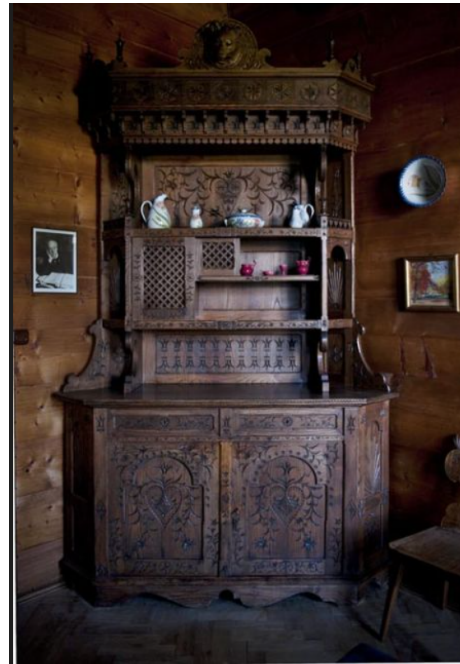
Рис. 1, 2. С. Віткевич. Проект кухонного буфету, стола та стільців і буфету з вітальні від гарнітуру «Вілли під піхтами» в Закопанському стилі. Автор: Казимеж Сечка, 1898 р. Приватна власність.