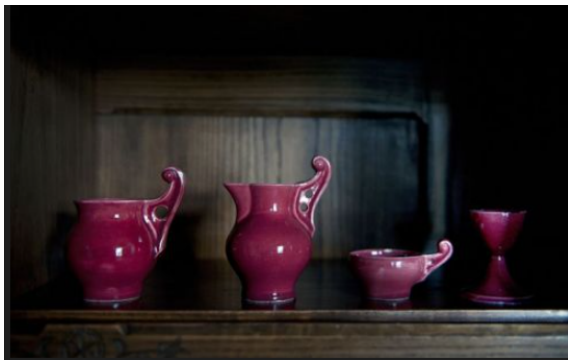
Рис. 3. С. Віткевич. Проєкт предметів в Закопанському стилі з кавового та чайного сервізів. Виробник: Фаянсовий завод Юзефа Недзвецького і Ко в Дембниках, бл. 1902 року, приватна колекція».

Розробляючи комплексні пропольські проєкти в Закопанському стилі, архітектор і художник наповнював інтер'єри кавовими, чайними формами з металу, кераміки і фаянсу, предметами столових сервізів штибу сільничок, масничок, соусників, вершківниць, черпаків, тарілок (Рис. 3, 4). Окремо автор приділяв увагу дрібним прикрасам штибу брелоків, брошок, проєктував за вимогами синтезу мистецтв і серветки з фіранками.