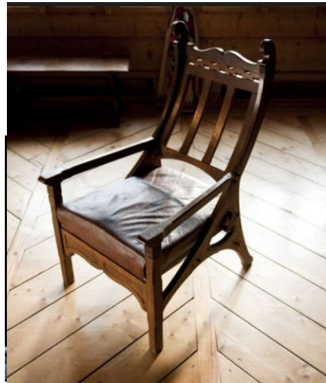
Рис. 4. С. Віткевич, проєкт крісла з вітальні Вілли Колиба. Автор: Войцех Бжега, 1902–1903. З колекції Музея закопанського стилю імені Станіслава Віткевича, філія Татривського музею в Закопане.

різний час на різних етнічних територіях України (Одещина, Кам'янець-Подільщина тощо) (Архів, 2024).