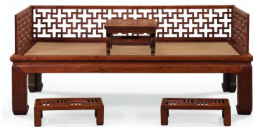
Рис. 7. Диван-кушетка. Династія Мін