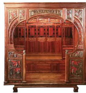
Рис. 10. Ліжко з балдахіном. Династія Цин