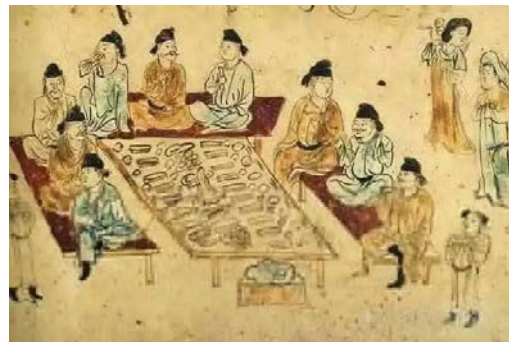
Рис. 2. Стінопис гробниці в с. Наньліван. Династія Тан

Робота Чжона Сунга має конотації одночасно і зі стародавніми традиціями сидіння на підлозі