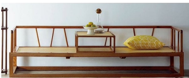
Рис. 8. Диван-кушетка від дизайнера Янфен Чен. 2011 р.

Окрім меблів для сидіння, вплив національних традицій меблевого мистецтва Китаю спостерігається у сучасних розробках меблів для сну. Історично сформоване ліжко з балдахіном часів династії Мін стало прототипом для сучасних дизайн-розробок. Конструктивна основа таких об'єктів являє собою міцну каркасну систему з дерев'яних опорних і навісних елементів, зібрану