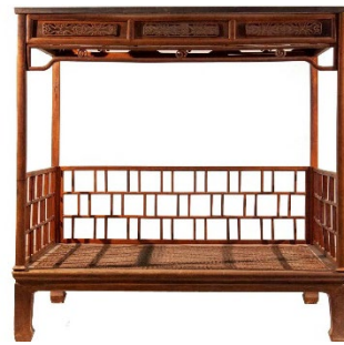
Рис. 9. Ліжко з балдахіном. Династія Мін

– інтерпретація об'єктів меблевого мистецтва. В даному методі історичний прототип стає відправною точкою для нової дизайн-розробки. В результаті інтерпретації у формі нового об'єкту вгадується вплив історичного періоду, проте немає конкретних елементів цитування. Застосовуючи даний метод сучасні дизайнери прагнуть відтворити естетико-філософську сутність, змістовність об'єкту. Метод інтерпретації спрямовано на переосмислення історичного минулого в контексті реалій сьогодення. Дизайнери ХХІ сторіччя враховують зміни у способі життя людей, трансформації соціальних реалій, появи нових матеріалів і технологій, що надає можливість організації