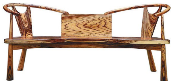
Рис. 5. Чжу Сяоцзе. Лаву «Butterfly»