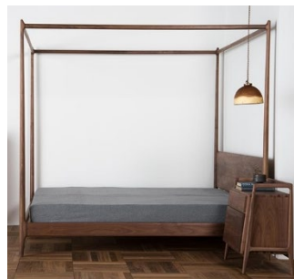
Рис. 12. Ліжко з балдахіном від компанії Fanji

естетично наповненого та функціонального предметно-просторового середовища.