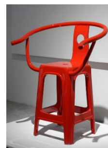
Рис. 6. Пілі Ву. Крісло Plastic Classic Loop