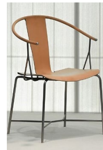
Рис. 4. U+. Крісло Rong Chair