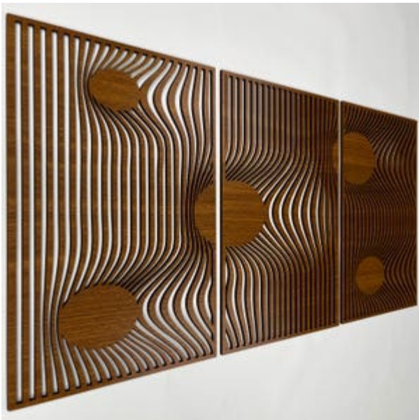
Рис. 7. Декоративна дерев'яна панель з оптичним ефектом

Сучасні дизайнери продовжують досліджувати нові способи включення деревини в дизайн житла, поєднуючи традиції з інноваціями, щоб створювати простори, які є не тільки функціональними, але й багатими на враження (Why Wood, 2025).