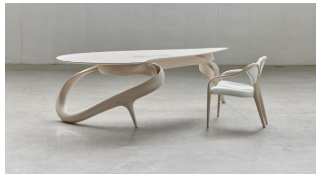
Рис. 4. Письмовий стіл Енігмун

Застосовуючи інноваційні методи обробки деревини, фахівці досягають не лише високої міцності та довговічності виробів, але й їхньої візуальної привабливості.