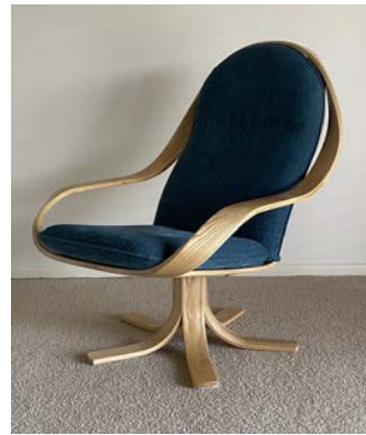
Рис. 3. Скульптурний комфорт «Хмара»

Волш проектує та створює вироби з деревини, які, на його думку, стимулюють розум, пробуджують почуття та існують як щось більше, ніж наше традиційне уявлення про меблі та дизайнерські предмети. У серії «Лілія» Волш досліджує взаємозв'язок між геометричним та органічним, поєднуючи симетричні повторення зі складними абстрактними формами. За допомогою кожного з цих прийомів Волш виявляє природний ріст, викликаючи емоції від випадкових поєднань абстракцій та цікавих природніх візерунків (Kate Sierzputowski, 2015).