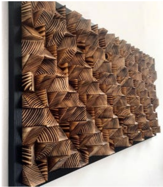
Рис. 6. Декоративна дерев'яне панно