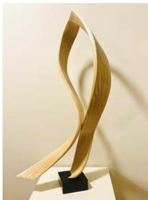
Рис. 2. Скульптура із гнутої деревини «Грація»

Відомий дизайнер Джозеф Волш, працюючи з деревиною, вважає, що якість життя можна покращити, оточуючи себе роботами, які цінуються не лише за їхню форму та функцію, а продуманим хаосом – ідея, що втілюється в його функціональному мистецтві та скульптурах з використанням технології гнуття деревини (рис. 4. рис. 5).