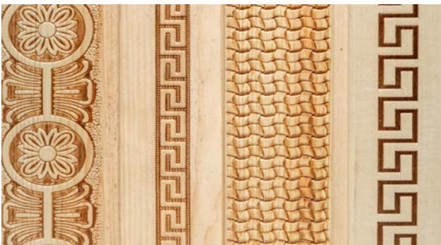
Рис. 1. Зразок декорованої поверхні деревини методом гарячого тиснення

Приклад декорування поверхні деревини методом гарячого тиснення, яке дає змогу швидко, недорого та ексклюзивно прикрасити інтер'єр, екстер'єр будівлі, різноманітних дизайнерських об'єктів, вносячи колоритні деталі краси та затишку можна бачити на рисунку 1. Іншим прикладом використання нинішніх технологій у виготовленні художніх об'єктів з деревини є гнуття пропереної або підпресованої деревини (див. рис 2. рис 3).