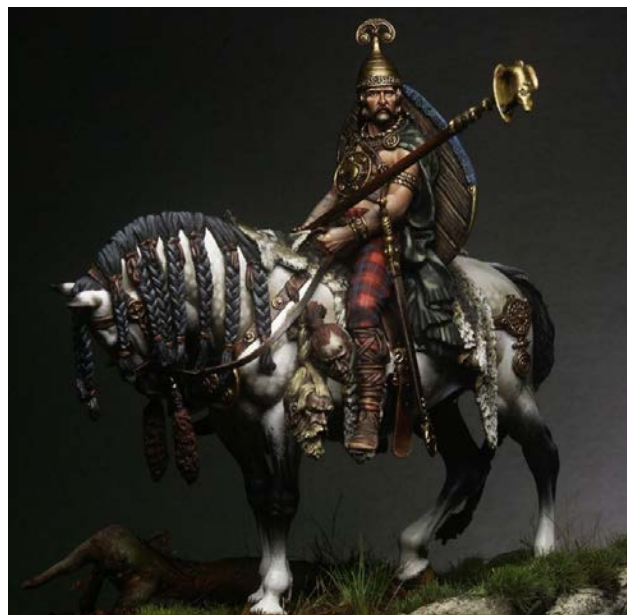
Іл. 1. Кельтський вершник, 75мм фігура від Pegaso Models, розпис та оформлення Данило Картаччі (акрилові та олійні фарби) (Енциклопедія сучасної України)

зації. Це приклад ідеального використання техніки OSL (Object Source Lighting) імітації світла від конкретного об'єкта на композиції. Джерело світла і головним акцентом є факел у руці солдата ліворуч.