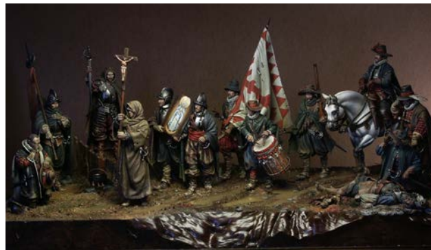
Іл. 4. «Диво в Емпелі», частина друга, момент врочишого проходження процесії з іконою із зображенням Непорочного Зачаття Діви Марії (Енциклопедія сучасної України)

Головний прийом Данило Картаччі тут – гра на протиставленні. Холодний сирий ландшафт з точною імітацією багна та калюж контрастно підкреслює постаті солдат в процесії, що з натхненням і надією несуть ікону. На цьому фоні обличчя солдатів виглядають максимально емоційно. Тепле світло на обличчях підкреслює їхню віру та надію, вириваючи людське життя з «мертвої», сирої та холодної атмосфери оточення.