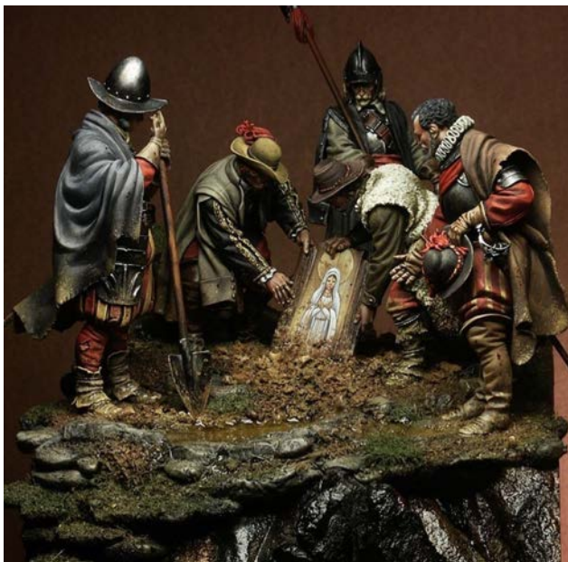
Іл. 3. «Диво в Емпелі», частина перша, момент винайдення ікони із зображенням Непорочного Зачаття Діви Марії (La Purísima Concepción) (Енциклопедія сучасної України)

Ця робота присвячена одній з найбільш містичних та героїчних подій у військовій історії, яка відбулася під час Вісімдесятирічної війни (Vázquez A., 1879: 540) несподіваній перемозі іспанців 8 грудня 1585 року поблизу Емпеля (Нідерланди), в якій оточені іспанські війська перемогли ворога, що значно переважав їх за чисельністю. Все почалося, коли в багнюці було знайдено зображення Святої Діви. Саме цей момент і демонструє в своєму диптиху Данило Картаччі. Значимість та символізм роботи впливає з розуміння історичного контексту події.