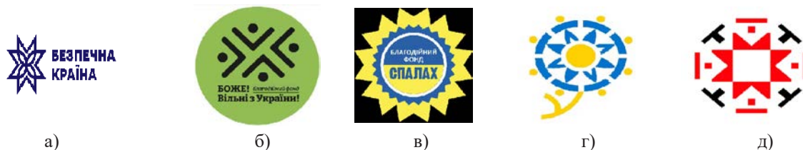
а) б) в) г) д)