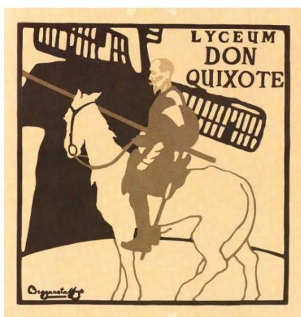
Іл. 8. Беггарстаффс. Lyceum Don Quixote. 1895.

Афіша Беггарстаффс «Lyceum Don Quixote» (Іл. 8) для театру Генрі Ірвінга, створена у 1895 році, також була відхилена останнім. Моделювання обличчя Дон Кіхота є найскладнішим з усіх обговорюваних вище дизайнів і таким, що потребує надзвичайної майстерності. Митці працюють рваними краями та нервовими лініями, риси обличчя загострені. Але ж і образ персонажа втілює одержимість, тож обличчя максимально передає психіку у графічній формі. Це те, що пізніше розвинеться в експресіонізмі. У цьому плакаті, на відміну від вищенаведених, принцип силуету поєднується з контурною лінією, яка вже не виступає допоміжним елементом (роздільною межею між двома площинами одного кольору, як у випадку з «Beefeater»), а є повноцінним засобом для створення форми-силуету за допомогою рисунку. Так, кінь сконструйований не тільки зіставленням площин (голова та передня частина тулубу), але і рисунком – лінією, що окреслює форму крупу та ніг коня. Це показує, що Беггарстаффс не слідували повсюдно власно виробле-