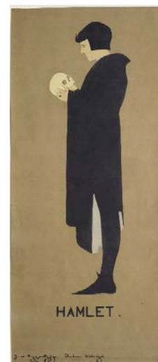
Іл. 4. Беггарстаффс. Гамлет. 1894

Варто зазначити, що силуетність у плакаті яскраво простежується і в роботах французького митця Анрі де Тулуз-Лотрека (Іл. 6). Хоча достовірні дані про те, що британські художники були знайомі із його творчістю, відсутні, Беггарстаффс все ж могли побачити і надихнутись його стилем у журналах «The Poster» (Лондон), «The Studio» (Лондон), де плакати європейських митців регулярно публікувались. На прикладі афіші «Moulin Rouge: La Goulue» (Іл. 6) видно, що у Тулуз-Лотрека зберігається рухлива, живописна лінія, що зумовлено специфікою літографії, його зображення окреслюють індивідуалізований психологічний типаж, тоді як Беггарстаффс використовували колажі з паперу і перетворили образ Гамлета (Іл. 4) майже на знак, надавши йому ще більшої умовності.