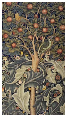
Іл. 2. Вільям Морріс. Дятел. Гобелен. 1885