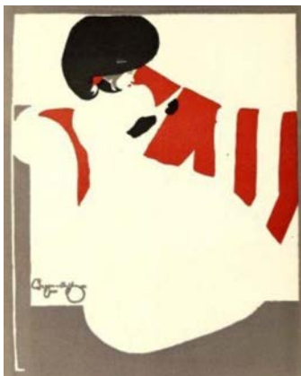
Лл. 5. Бегарстаффс. Дівчина, що читає. 1895