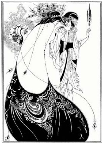
Іл. 3. Обрі Бердслі. Спідниця павича. Ілюстрація. 1893

Саме на тлі площинної декоративності модерну та японізму судилось сформуватись творчому дуєту Беггарстаффс. Позначення «Beggarstaffs», або «J. & W. Beggarstaff» було псевдонімом, який використовували британські художники Вільям Ніколсон (1872–1949) та Джеймс Прайд (1866–1941) для спільної роботи над дизайном плакатів та інших графічних робіт між 1894 та 1899 роками. Обидвох митців обтяжували канони академічної традиції. Крім того, за виразом Прайда: «не завжди можна продати свої картини; отже, вважаючи роботу з плакатами прибутковою та вбачаючи в ній дуже великі перспективи в Англії, ми вирішили застосувати це» (Ambo, 1978: 47).