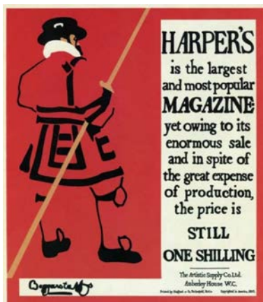
Іл. 7. Беггарстаффс. Реклама Harper's Magazine (Beefeater). 1895